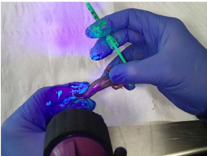
Marcatge d'un tritó amb elastòmer

Un cop a la natura, les primeres nits es va dur a terme un seguiment intensiu per comprovar la seva adaptació al nou medi.