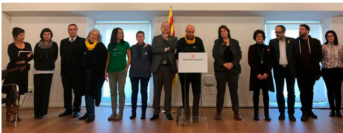
Acte de presentació del Consell Assessor del 8 de febrer de 2019

El Consell ha estat l'encarregat de definir la metodologia i impulsar l'estructura territorial que desenvoluparà el projecte des de l'autoorganització de la societat civil. Un cop s'ha definit el projecte el Consell es dissol. Per la continuïtat del projecte es constituirà la Coordinadora Nacional d'Enteses que es presentarà properament amb delegats de les Enteses, representatius dels diferents territoris.