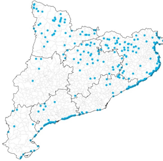
Activitats de càmping existents a Catalunya.

Com a exemple del seu impacte en el territori, cal dir que en el 27% dels municipis que compten amb càmpings, les places d'aquests establiments superen la població censada. La superfície mitjana dels establiments també és molt dispar, amb unes 3 hectàrees de mitjana en càmpings de muntanya i unes 7 al litoral. El 90% dels càmpings catalans no superen les 10 hectàrees de superfície.