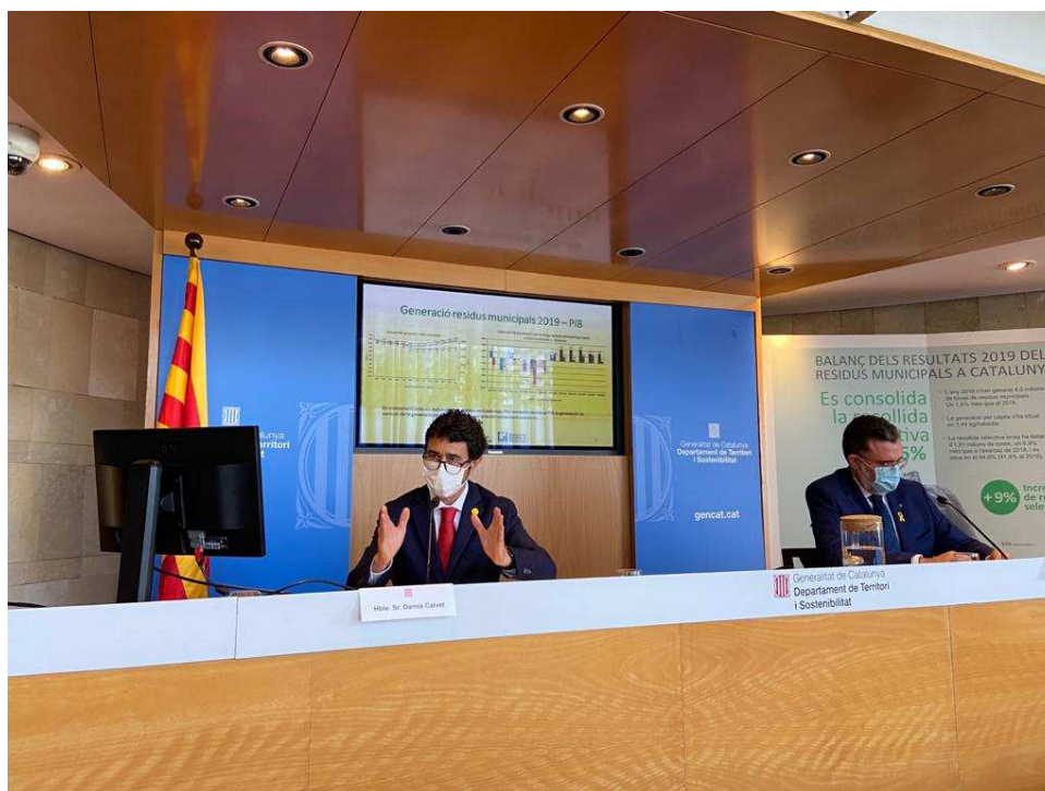
Moment de la presentació de les dades de residus.