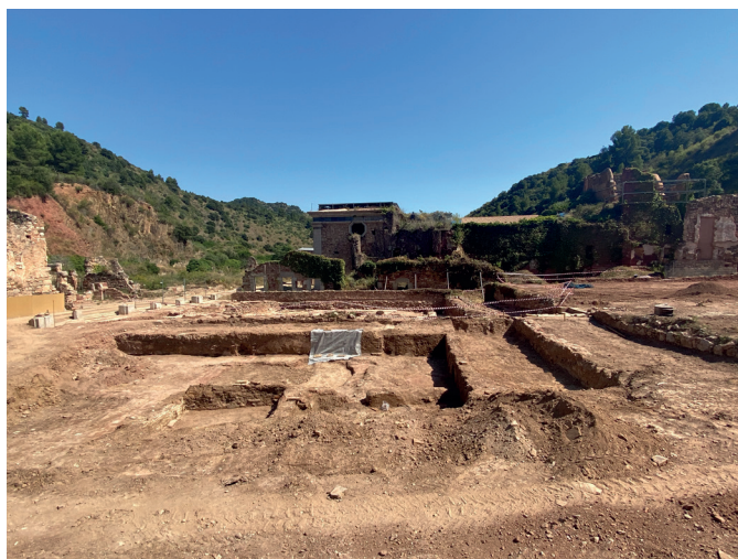
Treballs en curs a la zona que ocupava el claustre major.