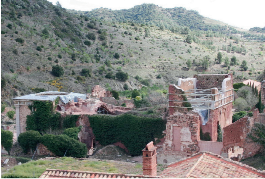
Vista general de l'àmbit de l'actuació.