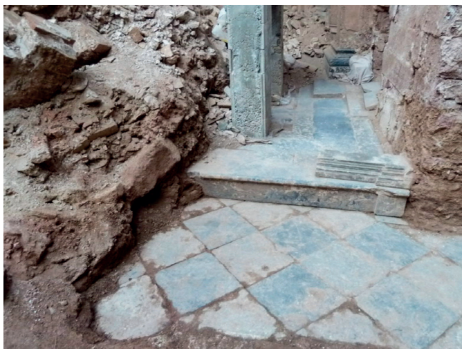
Detall del paviment en la zona de transició entre la nau i el presbiteri.