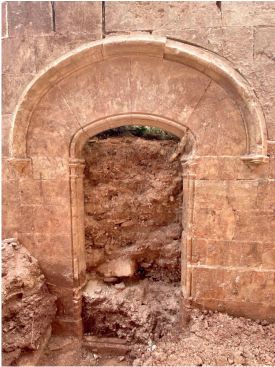
Portalada d'una de les capelles gòtiques ara desenrunades.