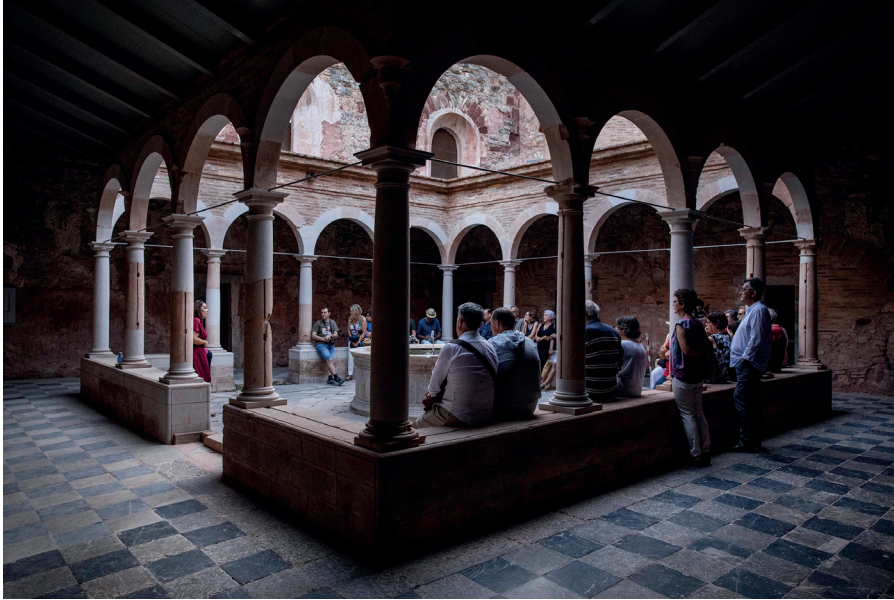
Claustre menor de la Cartoixa després d'haver estat recuperat.