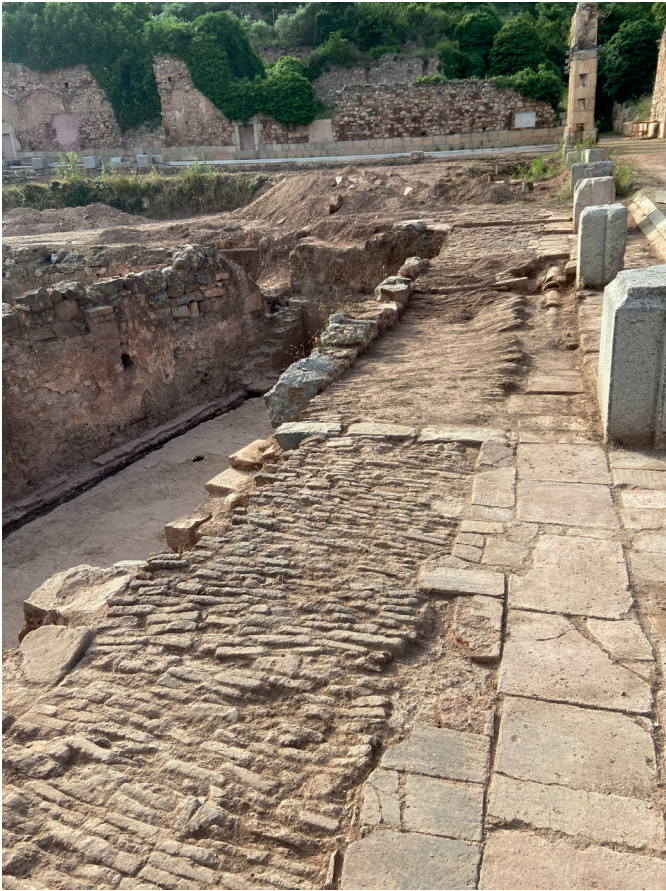
Detall del paviment desenrunat corresponent a les cel·les primitives.