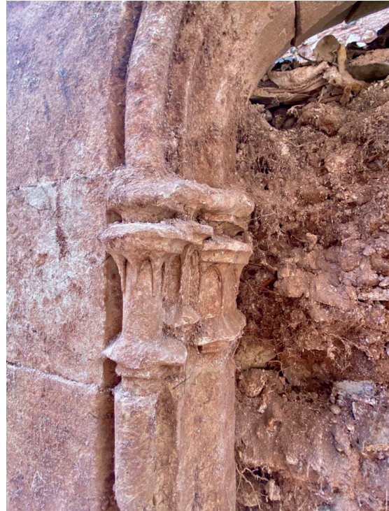
Detall de la portalada d'una de les capelles del segle XV.