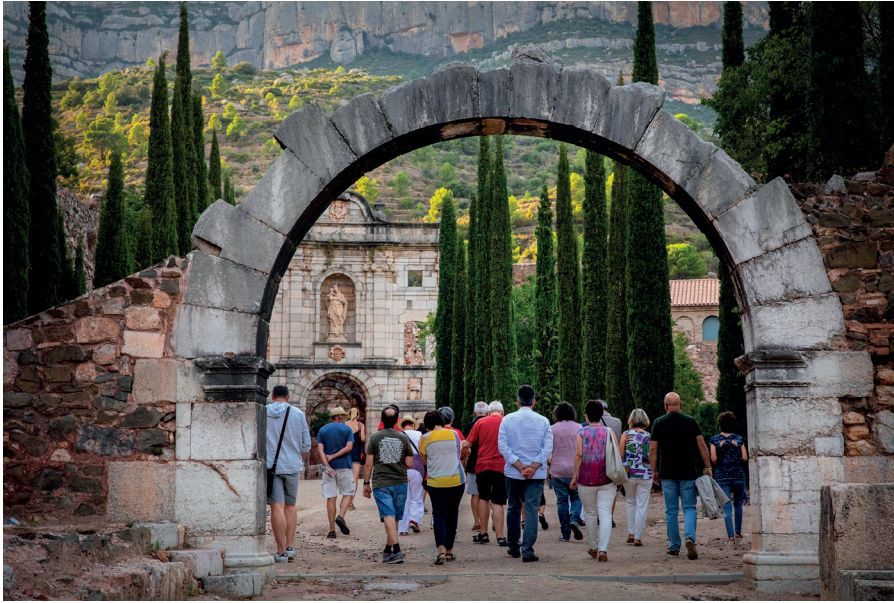
La Cartoixa d'Escaladei és l'únic monestir cartoixà accessible al públic a Catalunya.