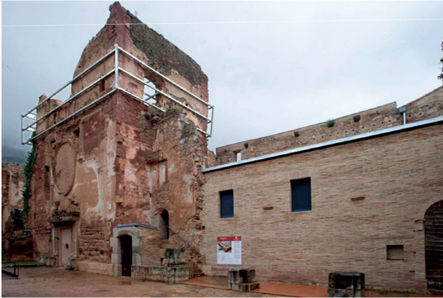
Aspecte actual de la façana de l'església.