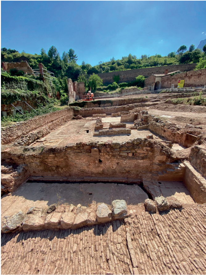
Estructura de les cel·les originals del segle XIII, ara desenrunades.