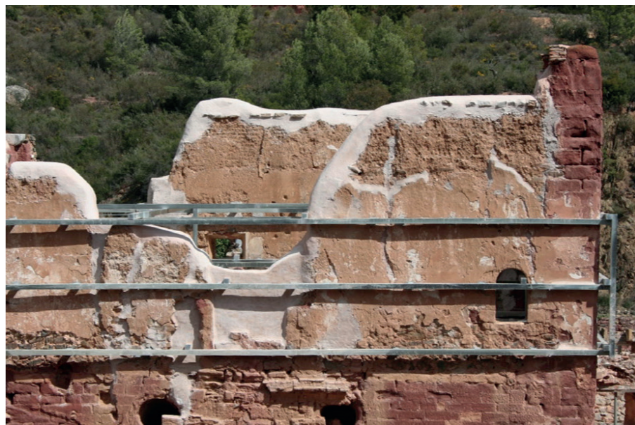
Detall del coronament del sobrecòs de l'església.