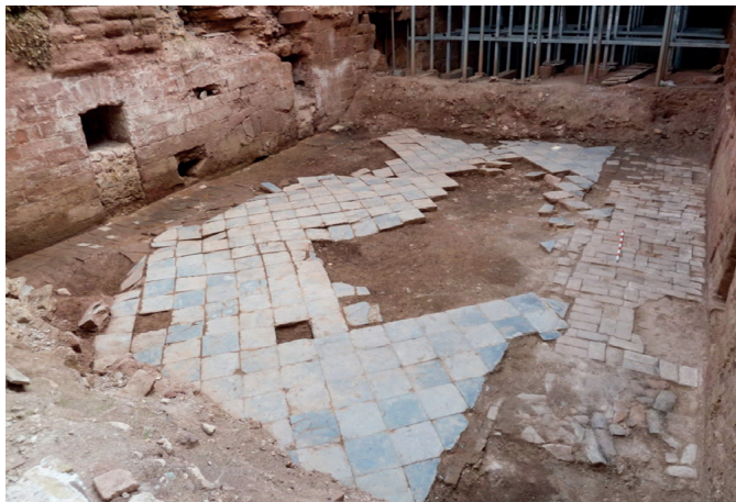
Aspecte del paviment de l'església conservat sota la runa.