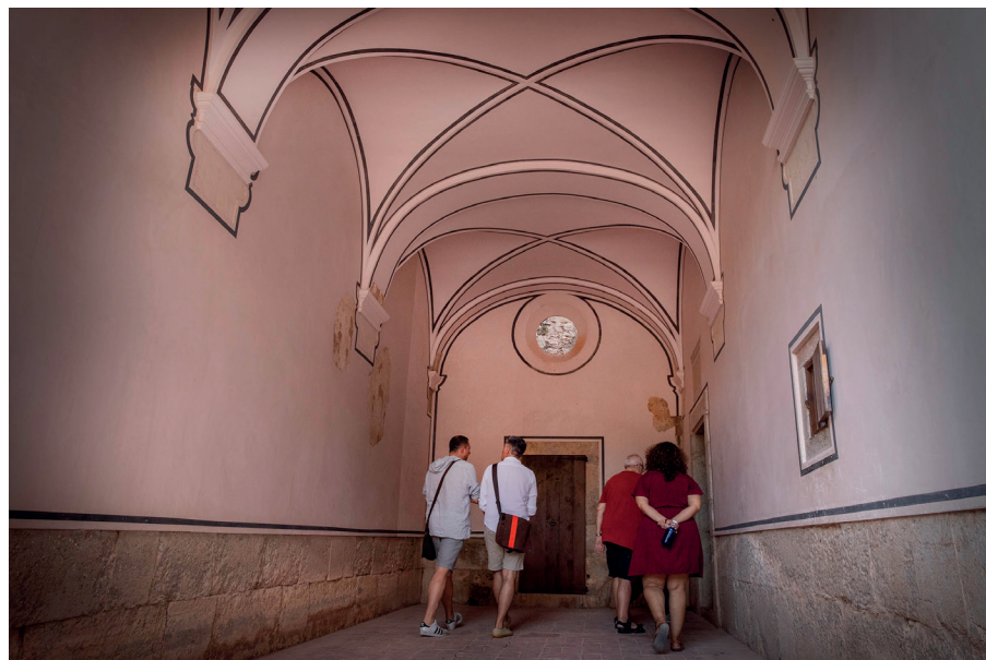
Espai d'accés interior a una cel·la.