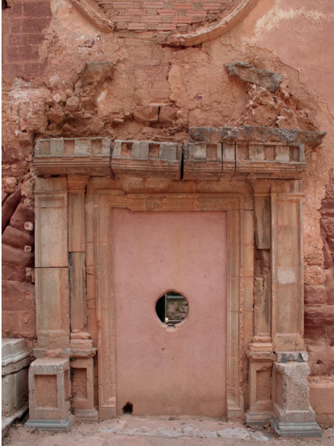
Estat actual de la portalada dòrica d'accés principal a l'església.