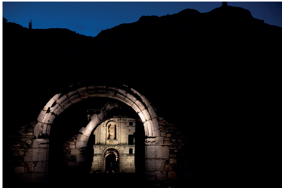
Façana principal de la Cartoixa.