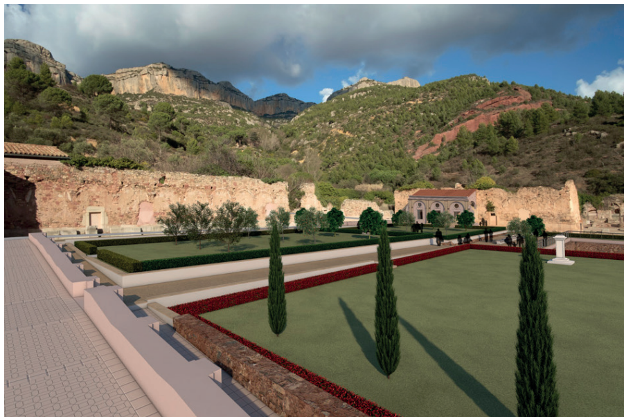
El claustre major. Projecte virtual.