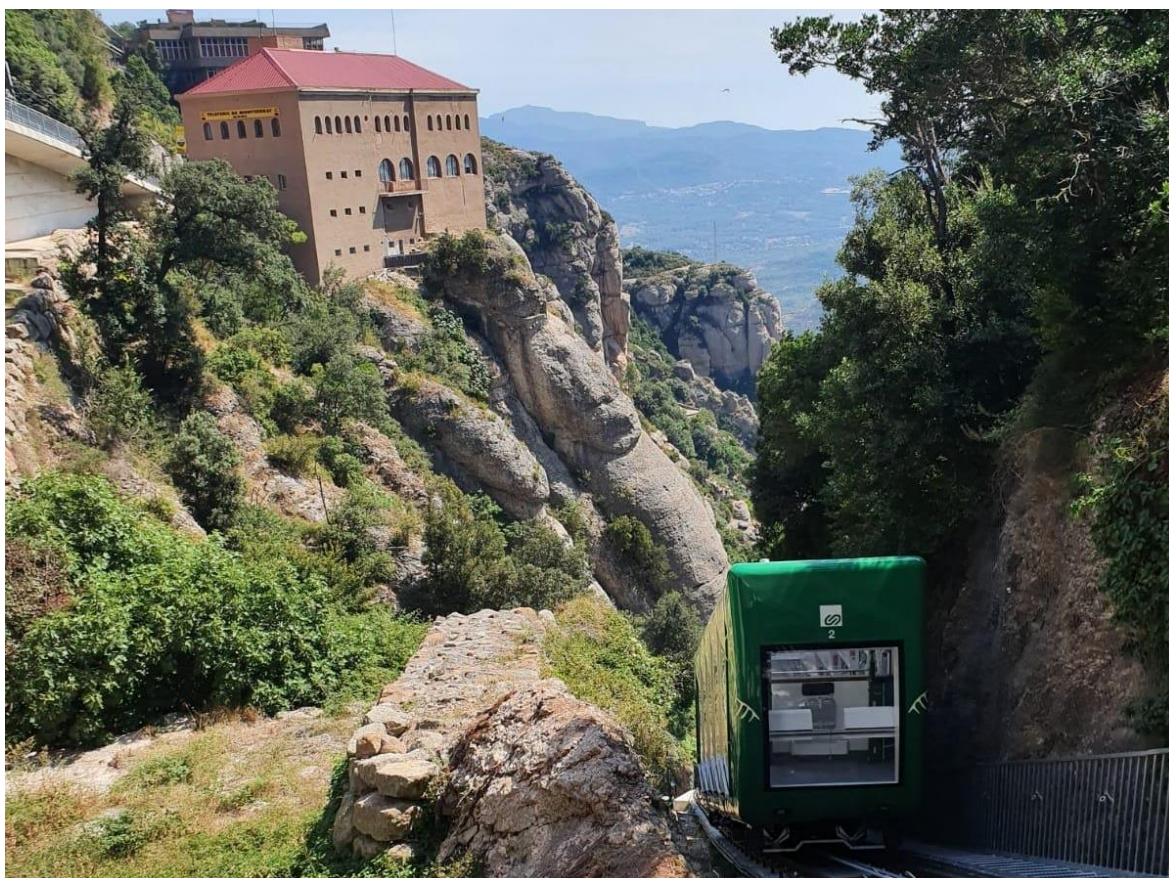
El Funicular de la Santa Cova durant les proves, aquesta setmana.

El Funicular de la Santa Cova tornarà a oferir servei a partir d'aquest dilluns, 17 d'agost, després de dos anys durant els quals s'ha realitzat una revisió a fons de la