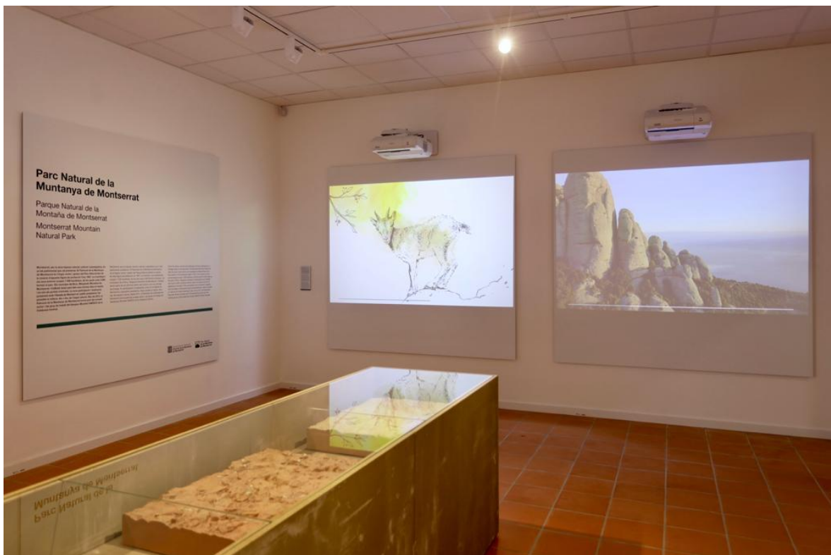
El centre d'interpretació del Geoparc obrirà dilluns vinent, 17 d'agost.

El rècord històric de visitants a la Cova va ser a l'any 2014, amb 170.885 i l'any 2017, previ al tancament, es va arribar a la xifra de 150.921 visitants.