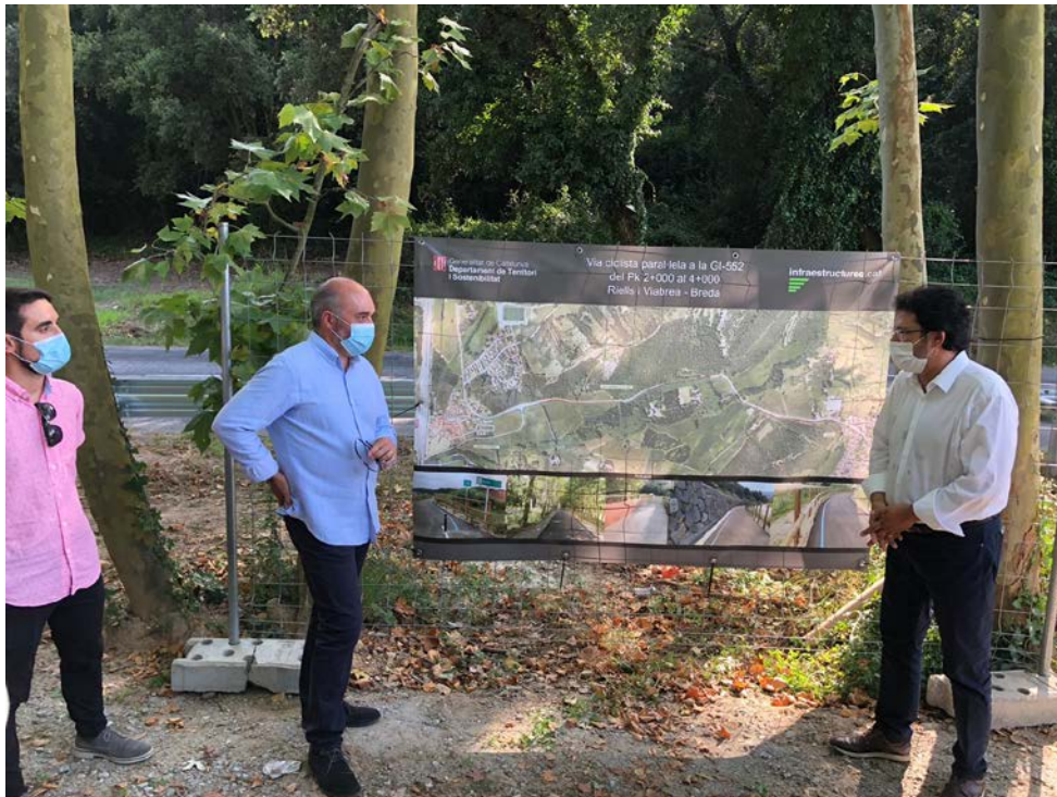
Inauguració de la nova via ciclista