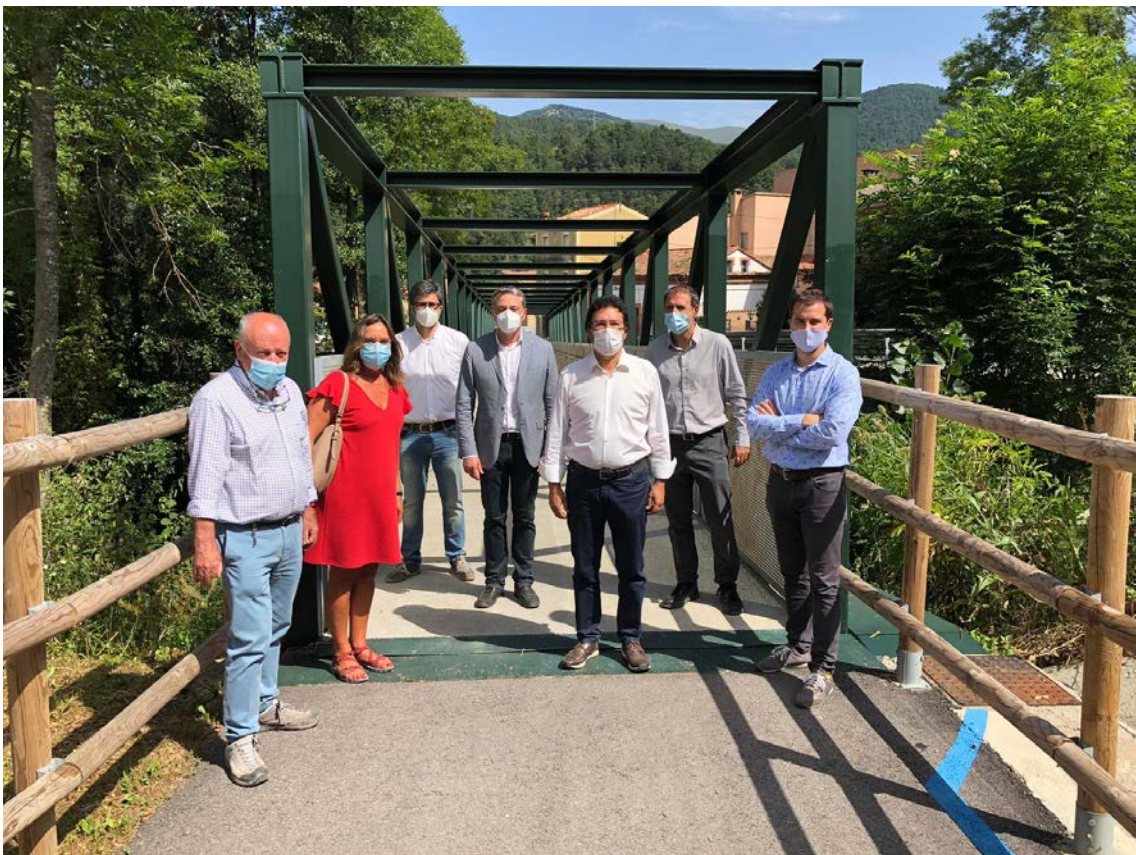
Visita a la ruta del Ter

El secretari d'Infraestructures i Mobilitat, Isidre Gavín, i el director general d'Infraestructures de Mobilitat, Xavier Flores, han visitat avui dues actuacions que s'emmarquen en les polítiques del Departament de promoure una mobilitat més activa i sostenible i, en concret, de potenciar l'ús de la bicicleta: la ruta del Ter al Ripollès i la nova via ciclista entre Breda i l'estació de tren de Riells i Viabrea-Breda, a la Selva. Aquestes actuacions, a més, estan alineades amb els objectius de l'Estratègia Catalana de la Bicicleta 2025, aprovada enguany pel Govern.