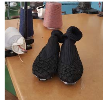
Transitory Textiles, de Sara González de Ubieta. Sabates de fils reactius al vapor i a la calor