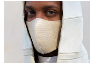
Wearepure.tech, de Noumena Peça de vestir estampada en 3D capaç de netejar l'aire

L'artesania interactua amb la innovació en diferents àmbits, en el creatiu, en el procés i en el resultat, i els materials són presents a tots tres. El fet de manipular els