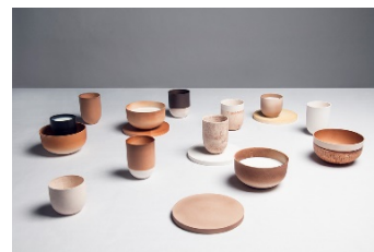
Care for Milk, d'Ekaterina Semenova, realitzat amb esmalt ceràmic obtingut de residus lactis

A Catalunya, un ciutadà mitjà genera més de 500 kg d'escombraries a l'any, als quals cal sumar els centenars de milers de tones de residus generats per la indústria. Siguin derivats de la producció alimentària, tèxtil o de la construcció, existeix una gamma de materials disponibles tan vasta com la que ens ofereix la natura, i la disponibilitat