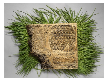
Interwoven, de Diane Scherer, realitzat amb patrons vegetals