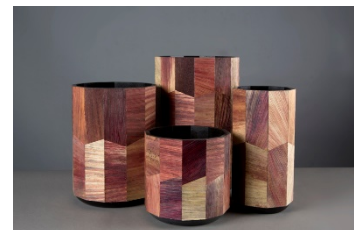
Totomoxtle, de Fernando Laposse, de xapa de fulles de blat de moro

L'artesania ha acompanyat la humanitat des del principi de la seva existència, sostenint i reflectint l'evolució de les societats. No obstant això, els canvis viscuts en les últimes dècades han estat més ràpids i profunds que en qualsevol altre moment de la història. Tant és així que algunes veus han proposat de batejar els nostres dies