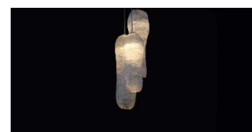
The Meat Project, d'Isaac Monté, realitzat amb carn descel·lularitzada