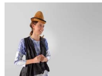
Materia Bruta, de Surzhana Radnaeva & IAAC. Peces de moda fetes de kombucha i bioplàstic