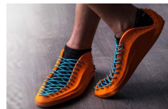
Sneakers II, de Recreus, realitzat amb impressió en 3D amb materials flexibles