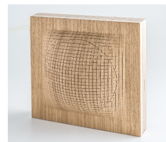
Inflatable Wood, d'Arca, de fusta inflable