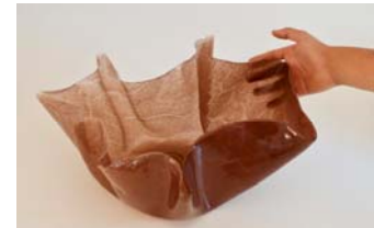
Re Olivar, de Naifactory Biomaterials extrets de pinyols d'oliva