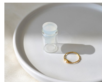
What's in a tear?, de Merle Bergers, realitzat amb pedres fabricades a partir de llàgrimes