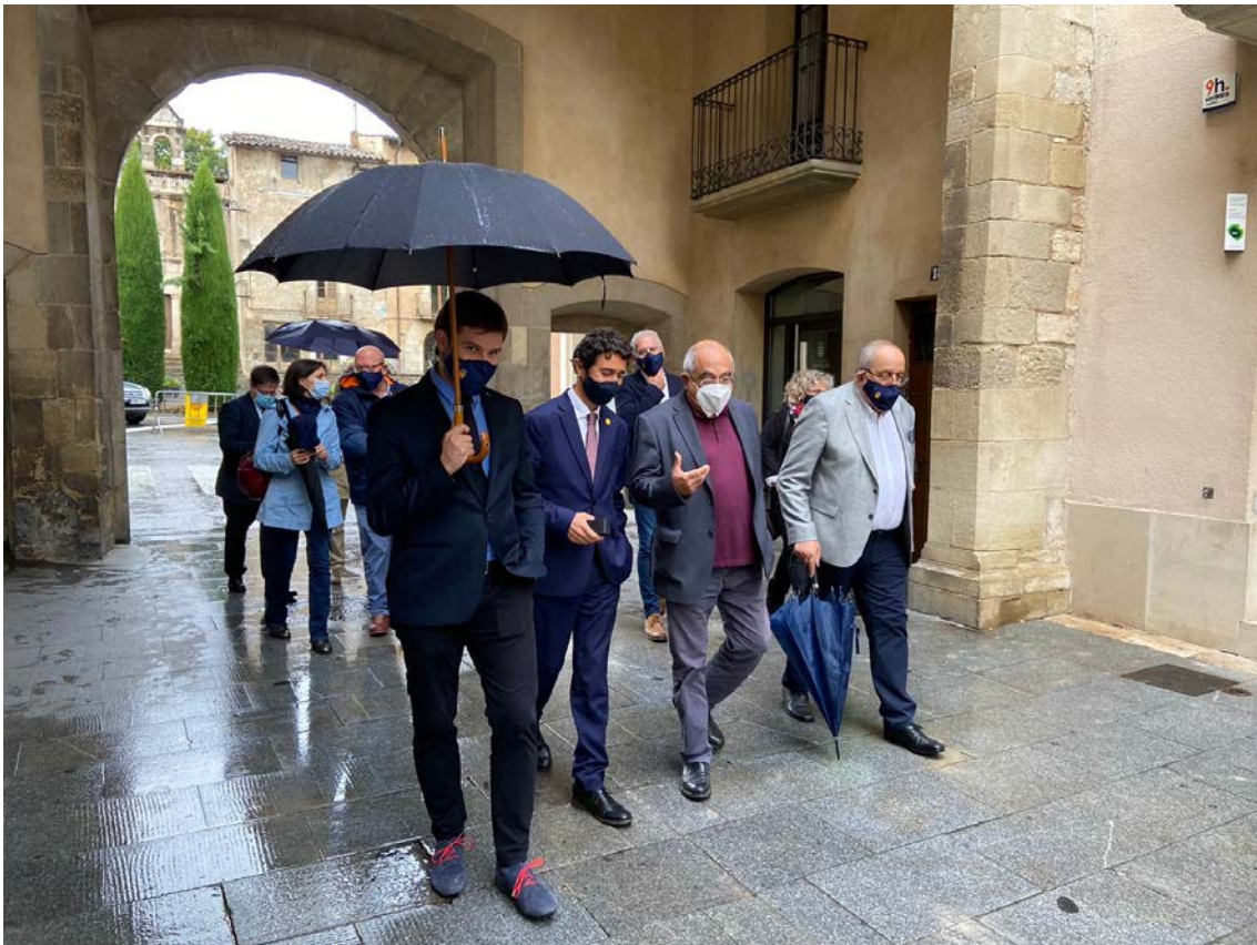
Visita al nucli antic prèvia a la xerrada