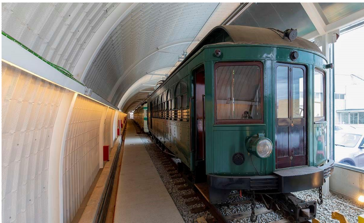
Espai “La Nau del tren històric del Vallès”, ubicada al Centre Operatiu de Rubí d’FGC.