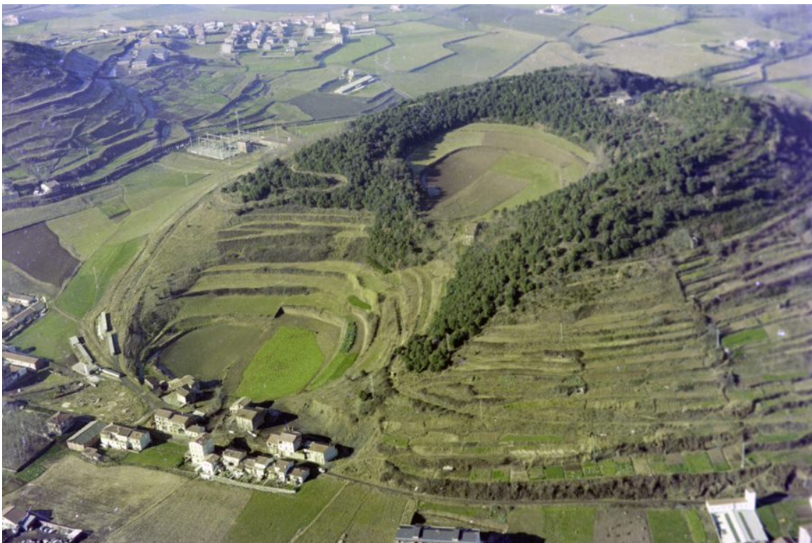
Volcà de la Garrinada, 1979.

Més informació sobre al Centre de Documentació del parc .