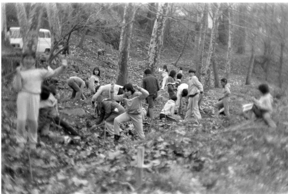
Festa de l'arbre a Olot, 1986.

El Parc Natural de la Zona Volcànica de la Garrotxa celebra el 39è aniversari de la seva creació amb l'ampliació del seu Fons documental. En aquest sentit, ha digitalitzat prop de 4.800 negatius d'imatges que testimonien el pas del temps des dels anys 70 en aquest espai natural protegit, amb l'objectiu de millorar la preservació, consulta i difusió del seu fons històric.