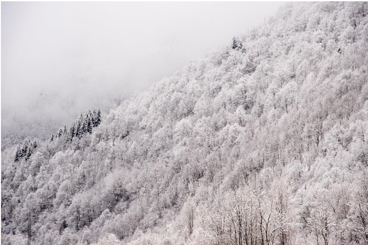
Imatge del Parc Natural de les Capçales del Ter i del Freser.

Espot i Boí Taüll , amb el Parc Nacional d’Aigüestortes i Estany de Sant Maurici , realitzaran també un projecte de recuperació de la memòria històrica amb l’objectiu de publicar-ne un llibre que serveixi per divulgar la història del parc.