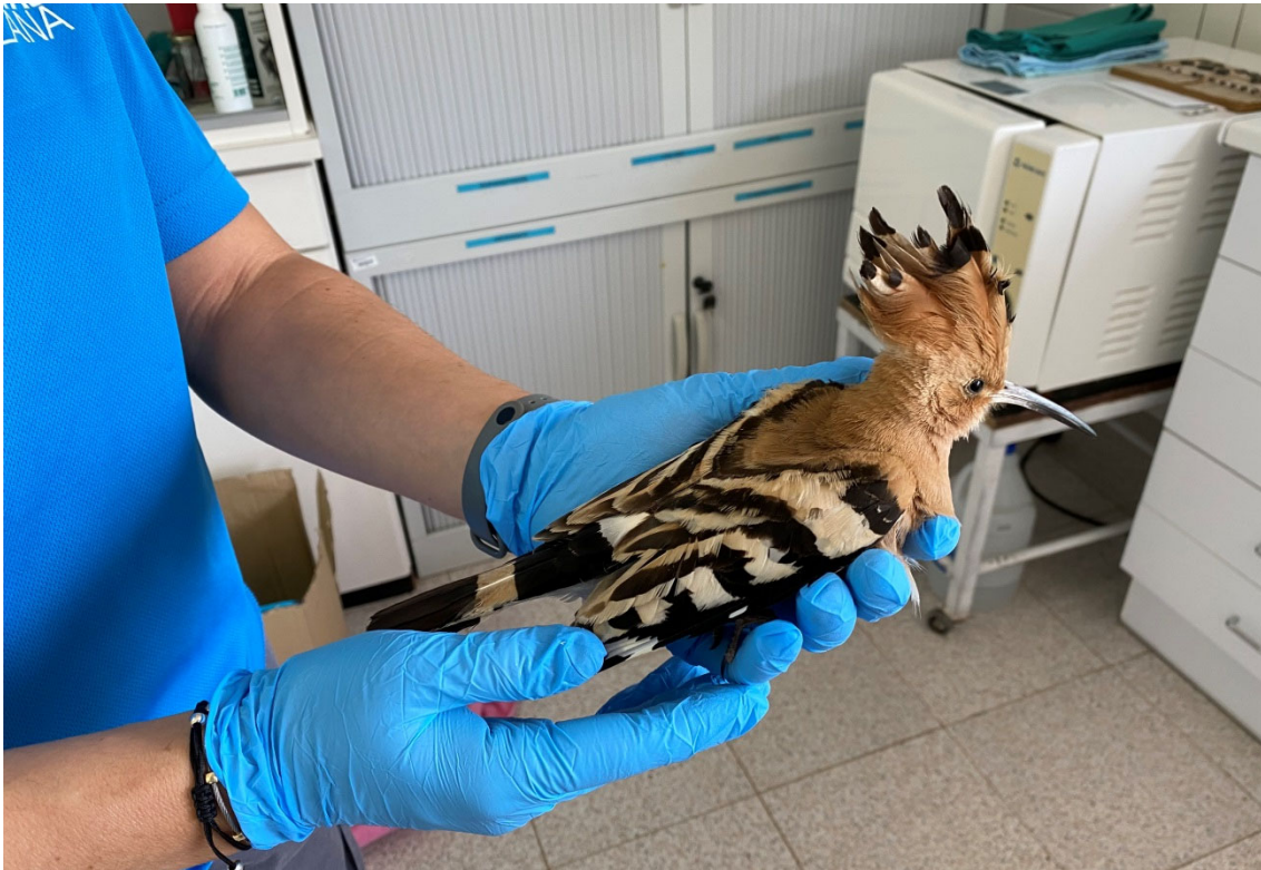
Puput ingressat al centre de fauna de Vallcalent

Els Centres de Fauna Salvatge (CF) de la Generalitat han atès durant el 2020 un total de 18.845 animals, segons es desprèn de les dades de la darrera Memòria de Centres de Fauna. Aquesta xifra representa un descens del 16% respecte de 2019, com a conseqüència de la pandèmia i les limitacions de mobilitat que ha comportat. El Departament de Territori i Sostenibilitat compta amb set centres de fauna repartits pel territori, quatre dels quals tenen activitats regulars de recuperació, a més de dur a terme programes de cria en captivitat.