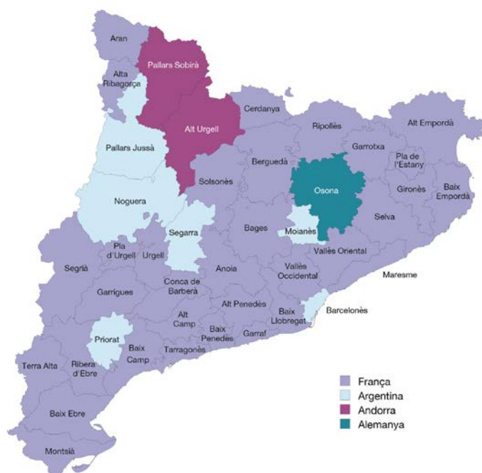
Població resident a l'estranger. Primer país de residència per comarques i Aran. 2021

Argentina és la primera destinació a 6 comarques, entre les quals destaca la Noguera amb un 57,6% i el Pallars Jussà amb un 46,2%. Andorra és la primera destinació dels residents a l'estranger procedents de l'Alt Urgell (84,3%) i del Pallars Sobirà (33,6%). I Alemanya és la principal destinació dels residents a l'estranger de la comarca d'Osona, amb un 32,2% del total de residents a l'estranger.