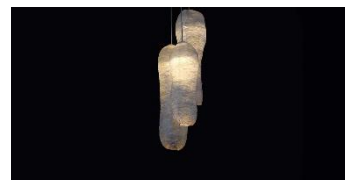
The Meat Project, d'Isaac Monté, realitzat amb carn descel·lularitzada