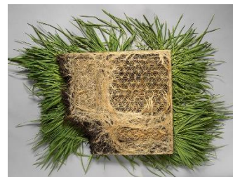
Interwoven, de Diane Scherer, realitzat amb patrons vegetals

Un nombre creixent d'investigadors i creadors estan desenvolupant materials diversos a partir de sistemes vius, i plantegen un model de cooperació amb la natura alternatiu a l'explotació. Organismes com els fongs o els bacteris són els actors clau d'una prometedora metodologia de producció, Do It Yourself («faci-ho vostè mateix»), que, imitant els cicles naturals, planteja un sistema circular, tancat i eficient.