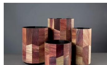
Totomoxtle, de Fernando Laposse, de xapa de fulles de blat de moro

La mostra, que s'ha pogut veure a la seu d'Artesania Catalunya a Barcelona i a Tortosa, ha viatjat també a Corea del Sud en una itinerància per tres ciutats del país asiàtic, a Changwon, Siheung i Seoul. A partir d'aquesta experiència a Lleida s'incorporaran treballs d'artesans catalans i coreans realitzats amb nous materials.