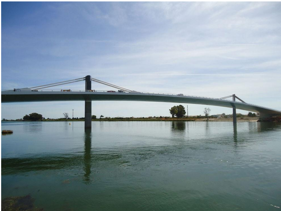
El pont de lo Passador , entre Deltebre i Sant Jaume d'Enveja.