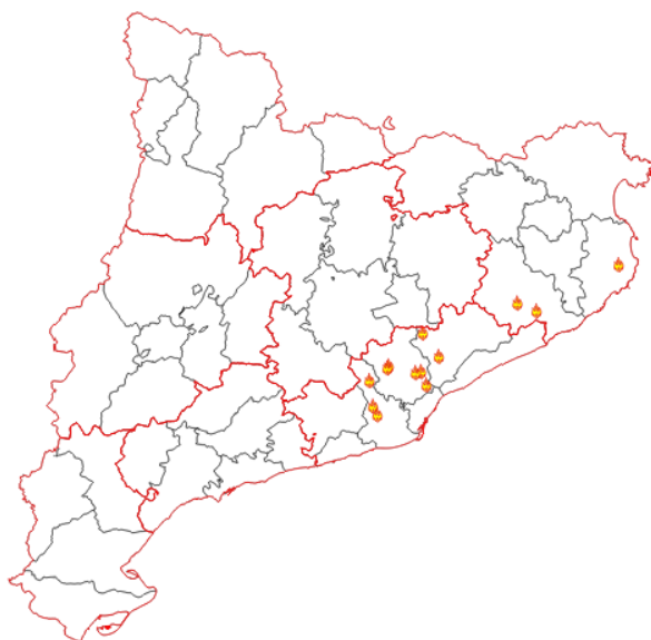
Localització dels incendis forestals a causa de pirotècnic 2021

Durant el mes de juny de 2021 s'han produït a Catalunya 12 incendis forestals* a causa de l'ús de pirotècnic, que han cremat un total de 19,96 hectàrees.