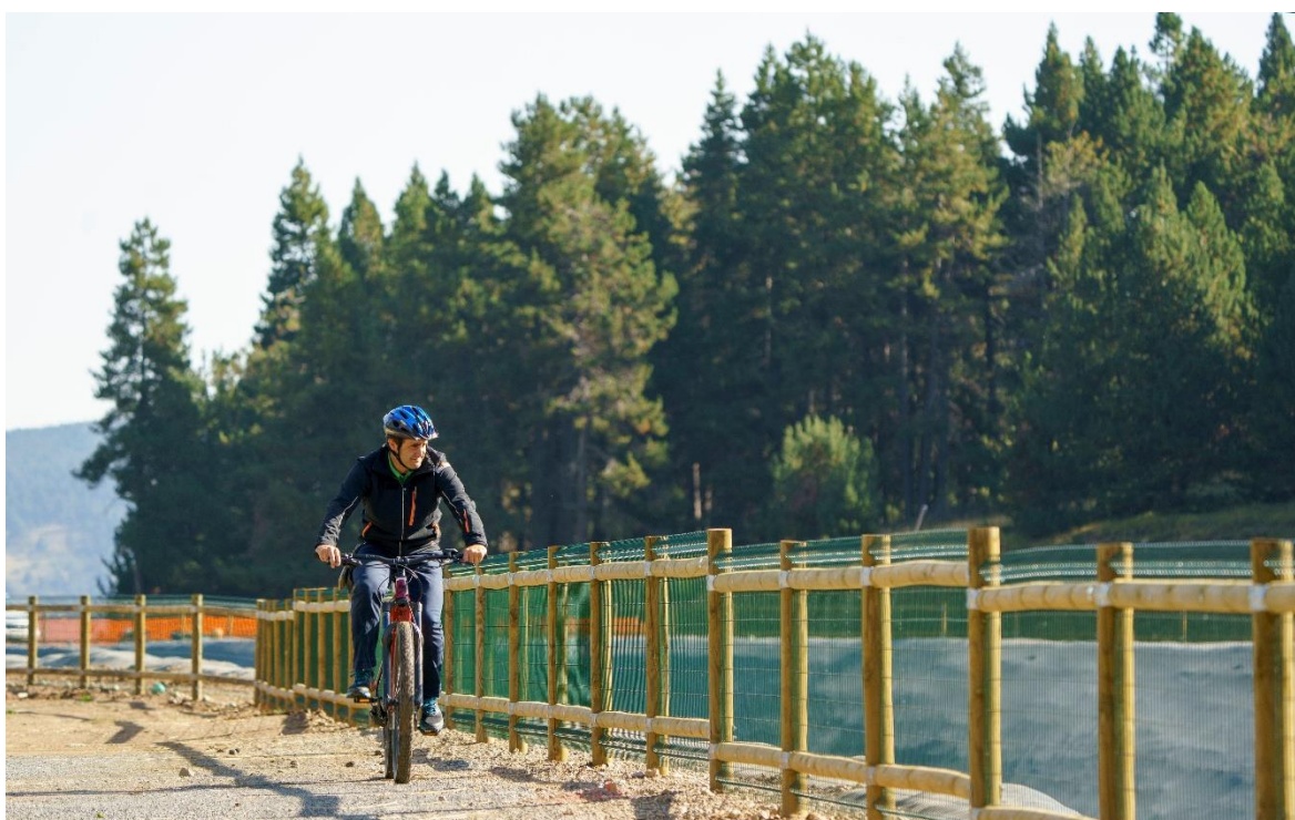
Un treballador de La Molina fa ús d'una bicicleta elèctrica per desplaçar-se a l'estació.

Ferrocarrils de la Generalitat de Catalunya (FGC) ha incorporat bicicletes elèctriques a les estacions de muntanya de La Molina, Vall de Núria, Boí Taüll i Vallter destinades a què el personal realitzi els desplaçaments interns i eviti, així, l'ús de vehicles de gasoil. D'aquesta manera, la companyia vol promoure una