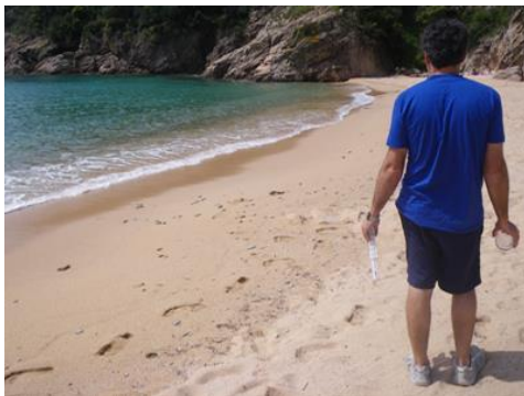
Tècnic fent inspecció en una platja.

L'Agència Catalana de l'Aigua (ACA) ha celebrat aquest dimarts la comissió de platges per avaluar la campanya de control de les aigües de bany litorals de Catalunya, que s'ha dut a terme entre l'1 de juny i el 24 de setembre.