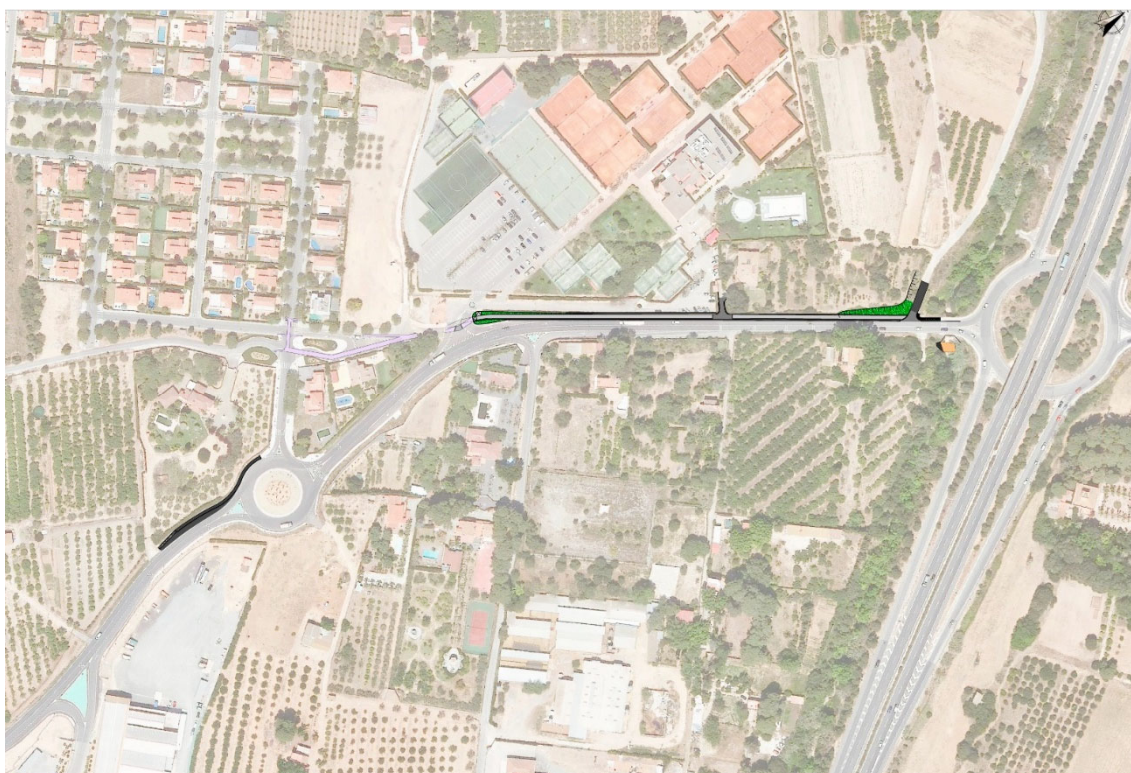
Ortofotomapa de l'actuació a Reus

El Departament de la Vicepresidència i Polítiques Digitals i Territori està treballant en diversos projectes arreu de Catalunya per a promoure una mobilitat descarbonitzada i afavorir la connectivitat mitjançant la construcció de vies ciclistes i per a vianants. Avui, n'ha presentat dos: un vial que connectarà la T-11 i la urbanització de Blancafort de Reus i una passarel·la sobre la C-55, que unirà el barri de Cal Gravat i el polígon de Bufalvent, a Manresa.