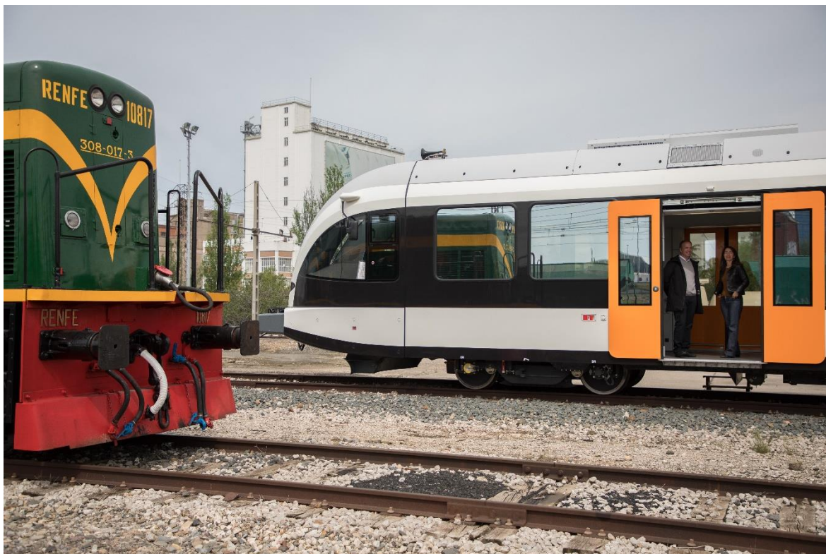
La nova unitat al costat del Tren dels Llacs.

Durant la visita també s'ha pogut veure el material històric del Tren dels Llacs, que comença la seva catorzena temporada demà dissabte 23 d'abril, Diada de Sant Jordi, i estarà en circulació tots els dissabtes fins al 29 d'octubre. En total, aquest atractiu servei turístic que ofereix Ferrocarrils, en col·laboració amb la Diputació de Lleida i l'Autoritat Territorial de la Mobilitat de Lleida, oferirà 28 circulacions: 24 del Tren Històric i 4 del Tren Panoràmic (23 i 30 de juliol i 8 i 13 d'agost).