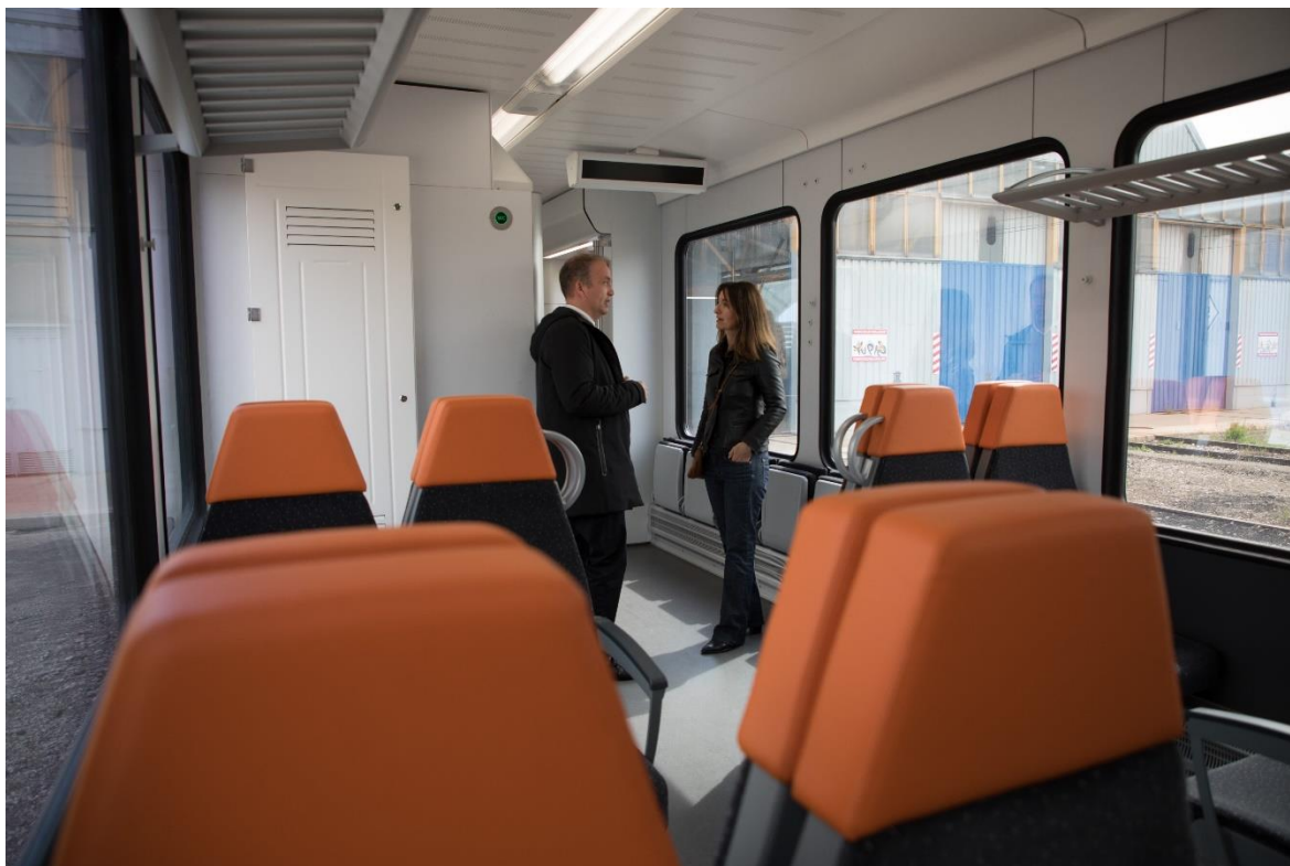
Subirà i Monsó visiten la tercera unitat, avui a Lleida.

El tercer tren de la línia Lleida-La Pobla de Segur de Ferrocarrils de la Generalitat de Catalunya (FGC) ja ha superat el període de proves tècniques i de circulació.