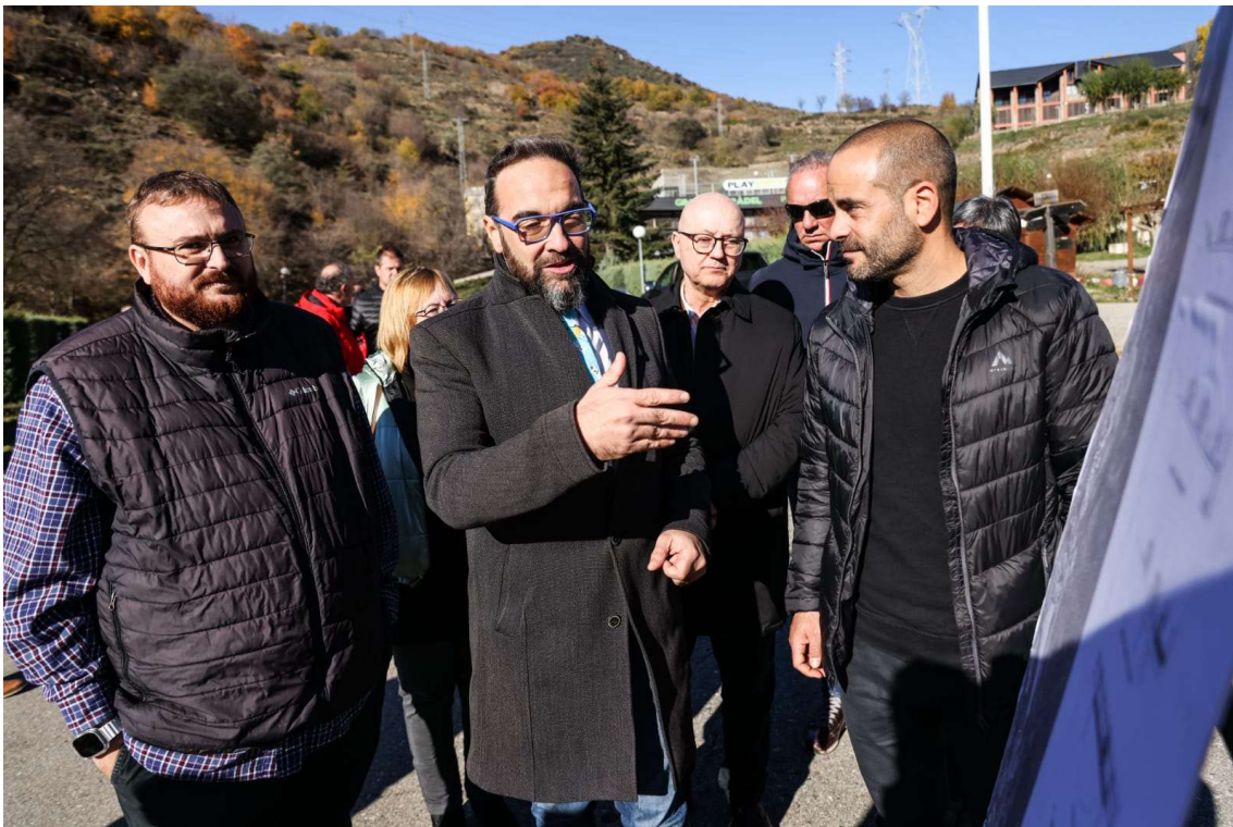
El conseller, Juli Fernández, en la presentació del projecte

El conseller de Territori, Juli Fernández i Olivares, ha presentat avui el projecte per a configurar una via per a vianants i ciclistes al corredor de la C-13 entre Sort i Rialp, que permetrà promoure una mobilitat activa i descarbonitzada en aquest entorn. El vial tindrà una longitud de 2,8 quilòmetres i comportarà una inversió de 2,5 MEUR, amb finançament FEDER. Les obres es licitaran aquest mes i es preveu que comencin el primer trimestre de l'any 2023.