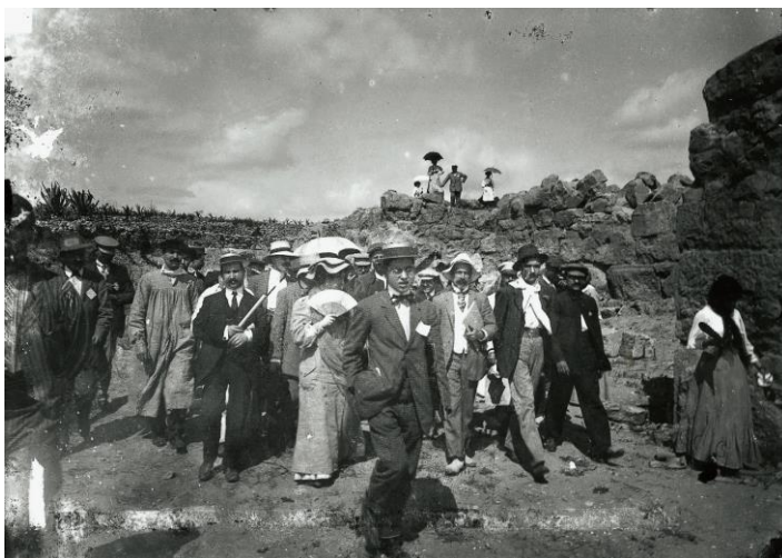
Els membres del Centre Excursionista de Catalunya desembarcant en llanxa per visitar Sant Martí d'Empúries i el jaciment arqueològic.

El naixement d'aquest topònim es va donar en el context de construcció de referents de país, en paral·lel al moviment polític i cultural del noucentisme. Des de llavors, polítics, escriptors i també artistes van ajudar a acabar de vestir la identitat d'un territori.