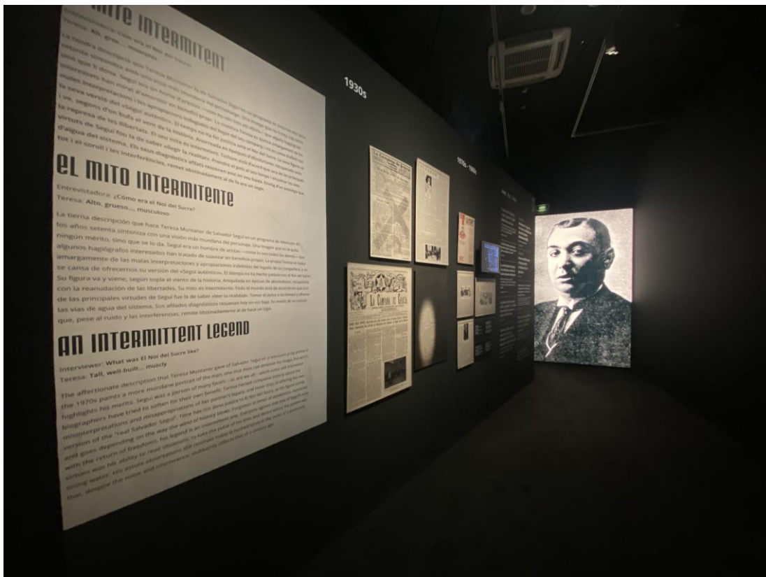
“Un mite intermitent”, dedicat a la vigència de la figura de Salvador Seguí

Uns foren de naturalesa externa, com la Revolució Russa del 1917 i l'onada d'agitació que va commocionar Europa acabada la guerra. Altres, d'origen intern, com la crisi de l'Estat definitivament oberta el 1917 amb la mobilització parlamentària i el descontentament de l'exèrcit. Exponent de la favorable conjuntura revolucionària és l'aliança de les dues grans centrals sindicals, la CNT i la UGT, que va portar a les manifestacions i les vagues generals dels anys 1916 i 1917, impulsades pel desmesurat encariment de la vida. L'augment dels preus estava estretament lligat a la guerra. La posició de neutralitat adoptada pel Govern espanyol va beneficiar molt la indústria catalana. Els països bel·ligerants necessitaven comprar, i perceptiblement les fàbriques i el camp català es van convertir en grans proveïdors. El creixement de la producció va significar l'alça dels salaris, però l'augment de la demanda va fer pujar els preus. La incapacitat política per fer front a la situació va comportar protestes que, sistemàticament, només obtenien per resposta la repressió.