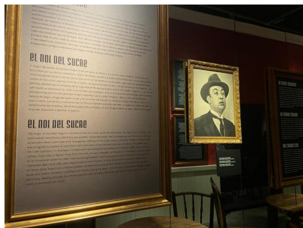
Detall de l'exposició "El noi del sucre"

Seguí és un personatge inclassificable, un home d'acció i de formació autodidàctica qui, en una època en la qual sovintegen les