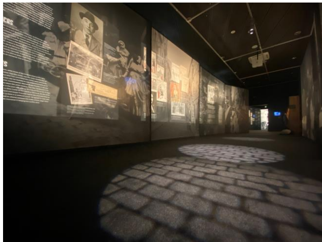
Part de l'exposició dedicada a explicar la violència a Barcelona

Barcelona, i bona part de la Catalunya industrial, van entrar en una espiral de violència entre l'any 1919 i el 1923. Obrers i sicaris a sou de la patronal s'enfrontaven a trets pels carrers. Aquest període ha passat a la història com els anys del pistolisme. En un fragment de la revista La Campana de Gràcia es podia llegir el següent: L'ús de la pistola ha esdevingut una cosa tan corrent com la ploma estilogràfica en els que saben d'escriure o la pipa en els que tenen el vici de fumar-hi. Una Star o una Browning no tenen gaire més importància que una caps de mistos. És un signe dolorós d'aquesta crisi.