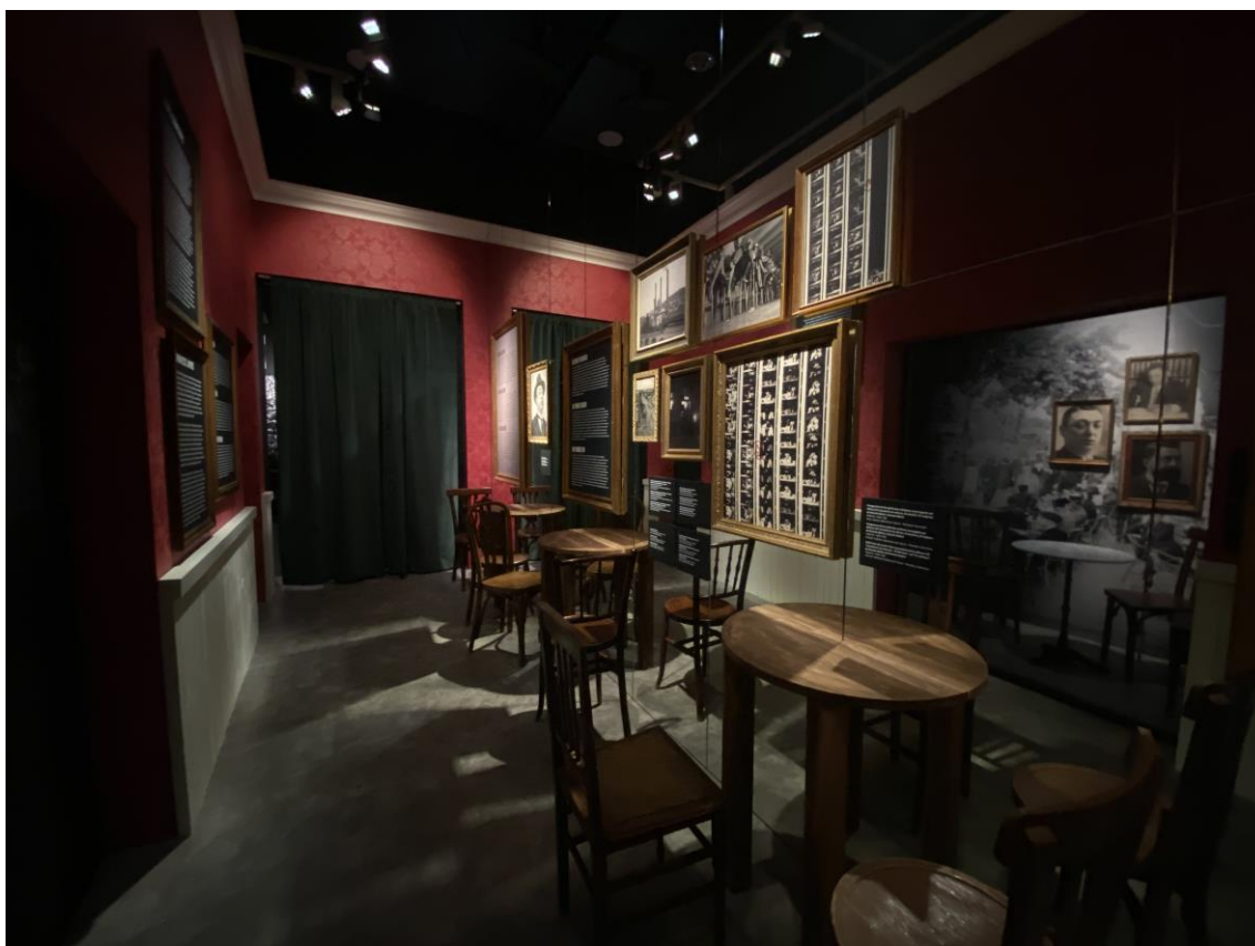
Imatge general d'una de les sales de l'exposició, que reproduïx un cafè de l'època

La relació entre els treballadors i els amos no era pas fàcil. La violència era tan quotidiana com la misèria. Salvador Seguí de seguida es va relacionar de seguida amb els moviments llibertaris que vertebraven l'organització dels obrers. Com a jove radical va viure els anys de la Barcelona coneguda com la Rosa de Foc i va tastar aviat la repressió i la presó.