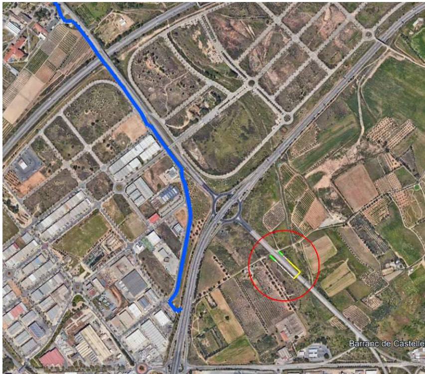
En vermell, la ubicació de la passera; en blau, la xarxa ciclable

El Departament de Territori ha adjudicat les obres per a construir una passarel·la per a facilitar la mobilitat de vianants i ciclistes i creuar per sobre la T-315, a Reus. Els treballs, que s'han adjudicat per un import de prop d'1,3 MEUR, començaran durant el segon semestre d'enguany i tindran un termini d'execució de nou mesos.