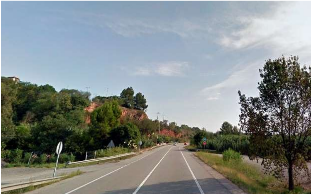
Tram de la C-55 entre Manresa i Sant Joan de Vilatorrada

El Departament de Territori ha licitat la redacció de dos projectes per a la millora de la C-55 al Bages i al Baix Llobregat, que corresponen a actuacions per afavorir la funcionalitat i la seguretat viària a aquest important eix de comunicació entre la Catalunya Central i l'àmbit de Barcelona. Així, estan en licitació les redaccions dels projectes per a la construcció d'un tram 2+1 entre Manresa i Sant Joan de Vilatorrada i d'un enllaç a diferent nivell a Olesa de Montserrat.