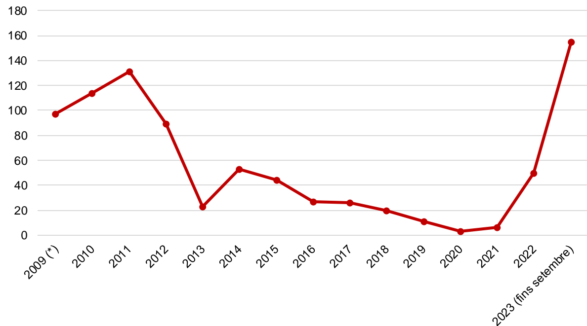
Reclamacions Corredor Vilafranca

L'any 2022, coincidint amb l'increment de la demanda del Servei, ja va haver-hi un increment de les reclamacions. Aquest increment es va continuar donant durant l'any 2023, si bé va ser amb retorn de l'activitat d'estudiants a partir del 12 de setembre quan hi ha hagut un increment exponencial d'aquestes. En el següent quadre es comparen per mesos les reclamacions de l'any 2022 i 2023. També cal tenir en compte que es preveu que en el pròxim mes continuïn arribant reclamacions del mes de setembre: