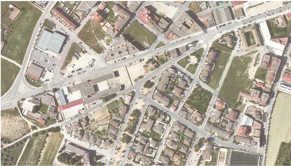
Situació de la parcel·la on es construirà el futur CAP.

La Comissió territorial d'urbanisme de les Terres de l'Ebre, presidida pel director general d'Ordenació del Territori, Urbanisme i Arquitectura, Agustí Serra, ha aprovat avui una modificació del planejament municipal de Móra d'Ebre (Ribera d'Ebre) que permetrà la implantació d'un nou Centre d'Atenció Primària (CAP).