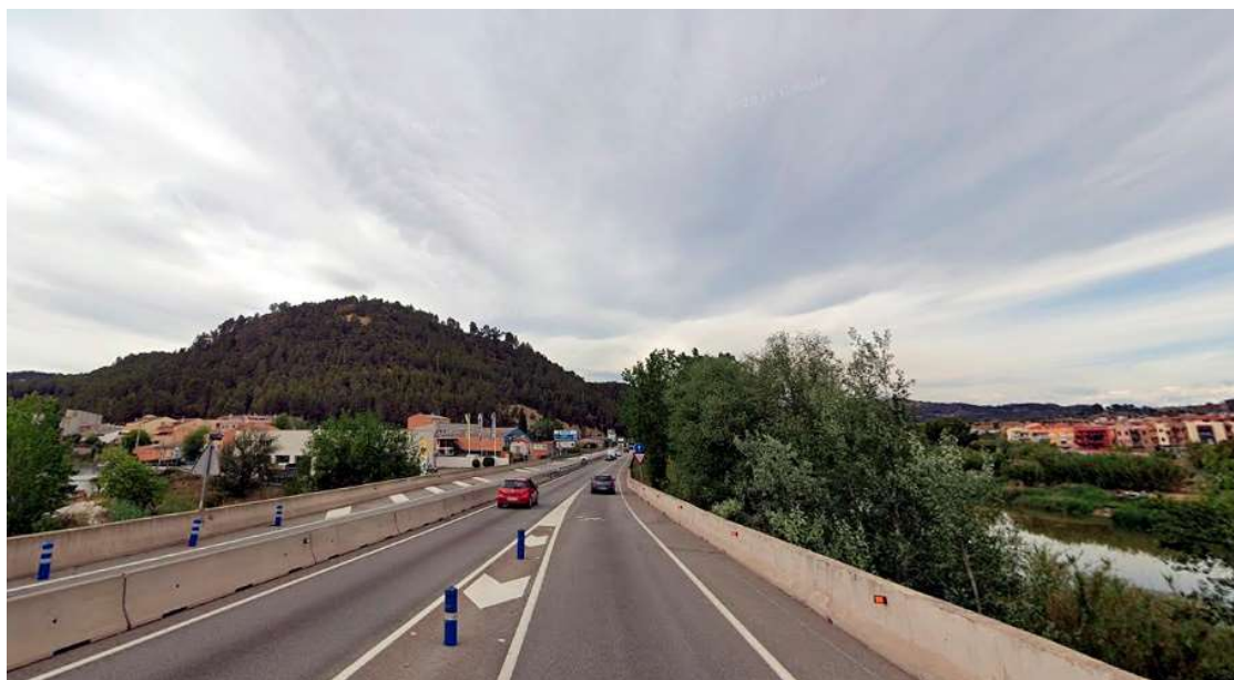
Fotografia de la incorporació que es perllongarà per a crear un segon carril a la carretera

El Departament de Territori ha adjudicat, per un import de 2,1 MEUR, les obres per a construir un tercer carril a la C-55 entre Sant Vicenç de Castellet i Castellgalí per a millorar la seguretat i la funcionalitat del trànsit en aquest àmbit. Aquesta obra s'emmarca en el pla d'actuacions del Govern per a reduir les congestions que es produeixen en aquest eix viari, especialment en hora punta, entre Castellbell i el Vilar i Manresa.