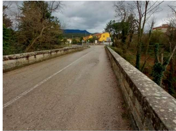
Dues vistes de l'actual pont

El Departament de Territori ha licitat les obres per a construir una passera per a facilitar la mobilitat dels vianants a la GI-503 i afavorir la seguretat viària, a Maçanet de Cabrenys (Alt Empordà), per un import d'1,1 MEUR. Aquesta actuació permetrà generar, a més, un itinerari per a la mobilitat activa que connectarà amb la vialitat del poble. Els treballs començaran al segon semestre de l'any vinent i tindran un termini d'execució de sis mesos.