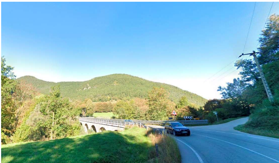
Pont actual de la C-38 entre Sant Pau de Segúries i Camprodon

El Departament de Territori ha licitat les obres d'un nou pont a la C-38, entre Sant Pau de Segúries i Camprodon, que permetrà millorar la seguretat i la comoditat en la conducció en aquest tram. Els treballs suposaran una inversió prevista de fins a 6,4 MEUR i es preveu que comencin el segon semestre de l'any que ve, amb un termini d'execució de 12 mesos.