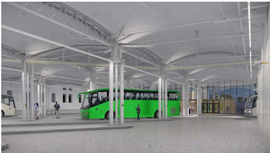
Imatge de les andanes de la futura estació