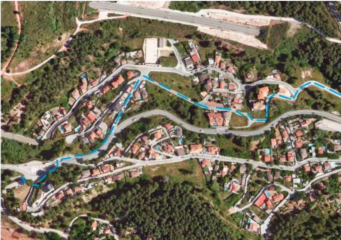
Tram de l'itinerari per a vianants

El Departament de Territori ha licitat obres de millora de la seguretat viària a la carretera C-243c, entre Terrassa i Castellbisbal, que inclou com actuació principal la configuració d'un itinerari per a facilitar la mobilitat dels vianants entre la urbanització de Can Santeugini (Castellbisbal) i l'estació d'FGC de Martorell Vila - Castellbisbal. Els treballs, que es liciten per un import de 630.000 euros, començaran a mitjan 2024. Aquesta actuació s'afegeix a un conjunt d'intervencions que el Departament està portant a terme per afavorir la seguretat viària i la pacificació del trànsit en aquesta carretera.