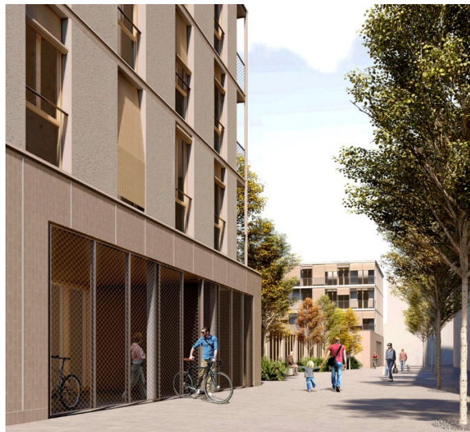
Imatge virtual de l’exterior de la promoció.

Els edificis de la promoció tenen una alçada de quatre plantes. Els habitatges de dos i de tres dormitoris se situaran a les tres plantes superiors, els locals comercials s’ubicaran a la planta baixa i l’aparcament i trasters a la planta soterrània. L’espai lliure de la parcel·la, no edificable, s’urbanitzarà i es cedirà per a servitud d’ús públic. Els accessos als quatre edificis es produeixen des dels passatges laterals paral·lels a la Ronda de Barceló, que esdevenen eixos verds per als vianants.