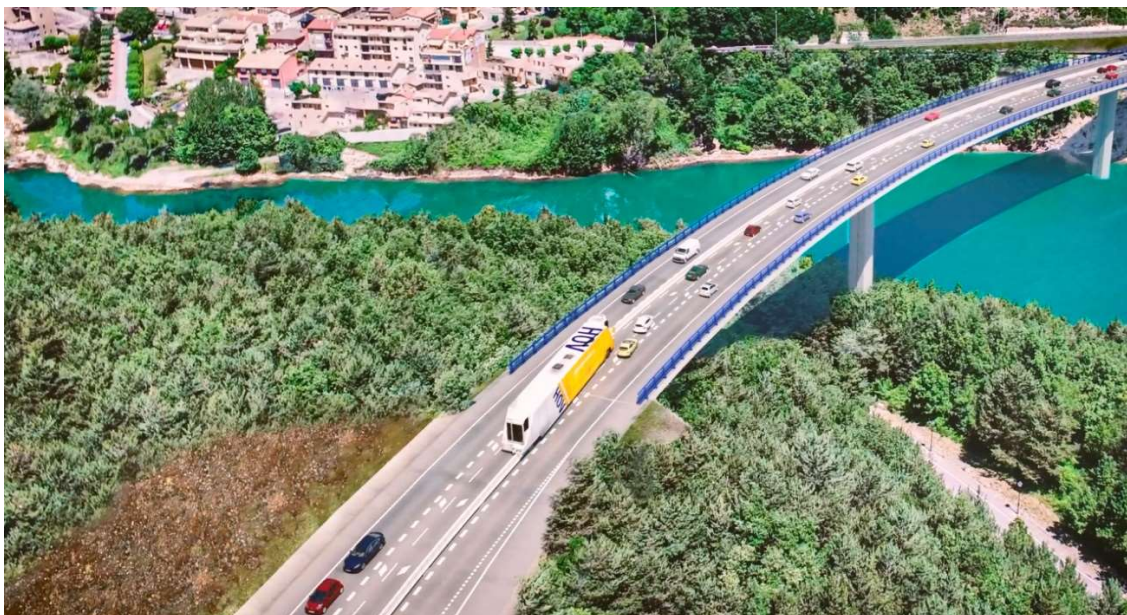
Imatge virtual del nou viaducte de la C-16 a Cercs i de la màquina que mourà la barrera mòbil

Atès que el trànsit és molt intens en determinades franges horàries només en un dels dos sentits, el tercer carril serà reversible; funcionarà en un sentit o en un altre en funcions de les necessitats i per a separar els sentits de la circulació, s'ha optat per la implantació d'una barrera mòbil.