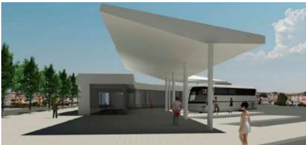
Imatge virtual de la futura estació

Actualment, Palamós disposa d'una estació d'autobusos situada al carrer López i Puigserver, al centre urbà, en una localització que dificulta la circulació dels autobusos, com a conseqüència d'una trama de carrers estrets i concorreguts de trànsit viari que fa difícil l'accés còmode d'aquests vehicles de transport de viatgers.