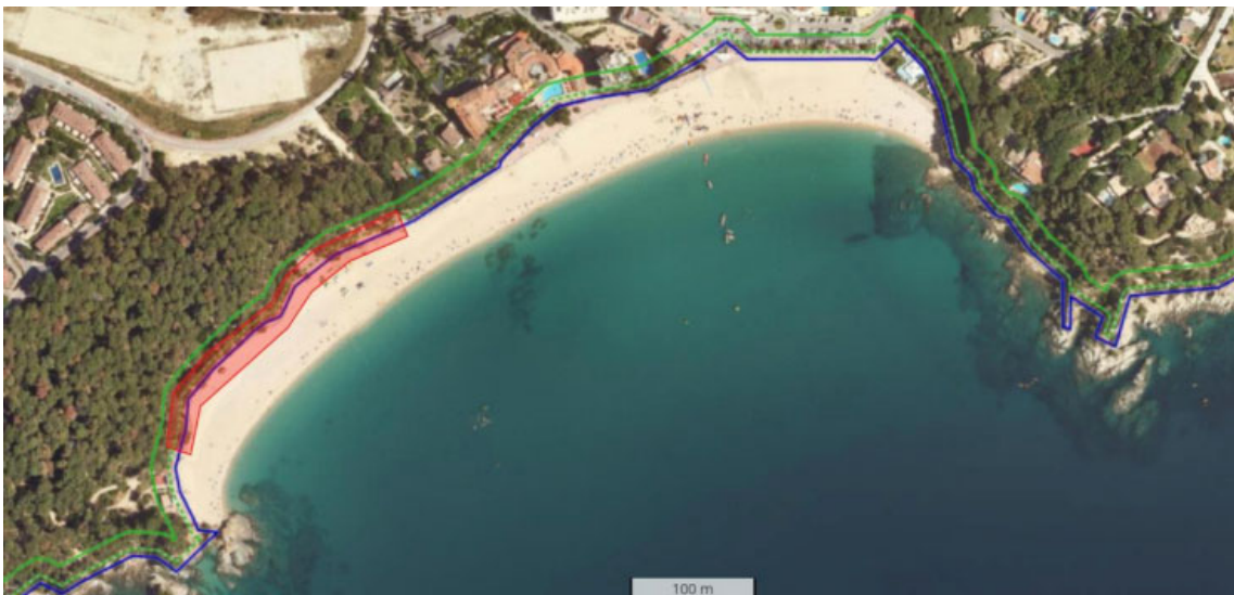
Tram del passeig marítim de la platja de Fenals objecte de l'actuació d'emergència.

Igualment, es reposaran els serveis públics afectats, com ara el clavegueram, l'enllumenat i els serveis d'aigua potable. Per tal de garantir l'ús de la zona durant la temporada de bany, també es preveu aportar sorra de platja per cobrir la protecció d'escullera.