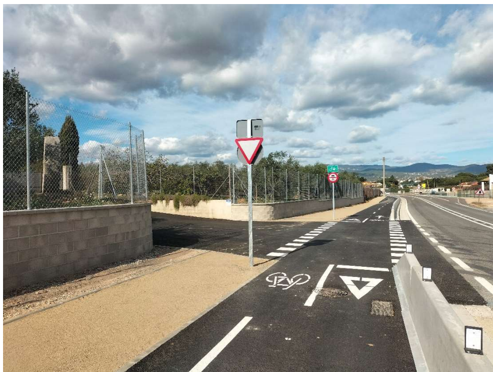
Un dels trams en funcionament de l'itinerari, a Reus

El Departament de Territori ha adjudicat les obres de la tercera fase de la via per a ciclistes i vianants en paral·lel a la TV-3141 que connectarà Reus i Cambrils, per un import de 3,7 MEUR. El tram que s'ha adjudicat permet fer arribar el vial des de la urbanització Aigüesverds, a Reus, fins al terme de Cambrils. Les obres, que compten amb finançament del fons Next Generation, està previst que comencin durant aquest estiu una vegada hi hagi la disponibilitat dels terrenys.