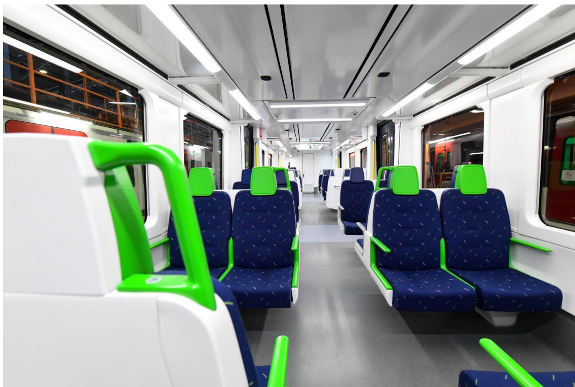
Nou disseny interior de les unitats 112, amb nou sistema d'informació al viatger.

Actualment, ja s'estan fent els treballs de renovació del primer tren, que actua com a prototip i que és previst que es posi en circulació la propera tardor. Un cop entri en servei aquest primer tren renovat, s'aniran rehabilitant progressivament la resta d'unitats. L'actuació es farà en primer lloc en les 16 unitats de tren adquirides l'any 1996, que s'aniran introduint a la línia amb una periodicitat de cada dos mesos i, posteriorment, en les 6 unitats que es van estrenar l'any 2003.