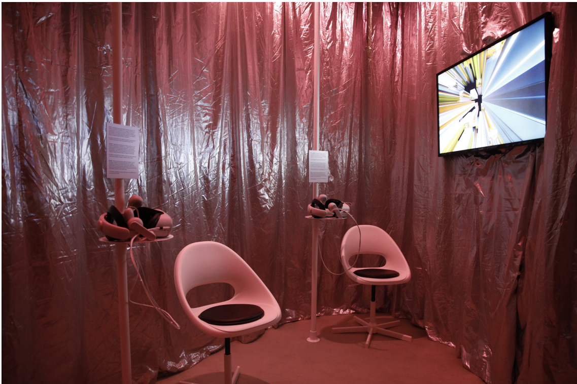
Exposició 'Recorda el futur' a Palau Robert

A través d'ulleres de Realitat Virtual, els visitants de l'exposició poden experimentar un viatge immersiu per conèixer com s'han desenvolupat les grans revolucions industrials a Catalunya: des de la mecànica a l'arribada de l'electricitat, passant per l'eclosió digital i projectant el futur que dibuixen la Intel·ligència Artificial i les tecnologies emergents.