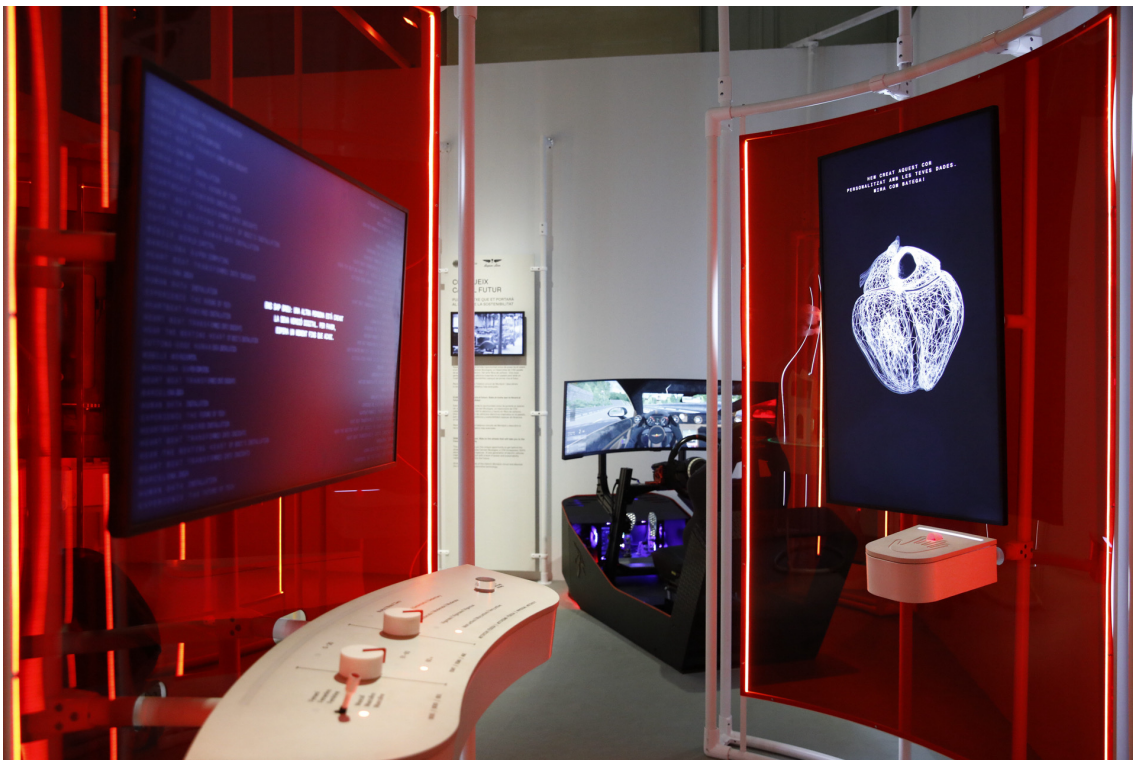
Exposició 'Recorda el futur' a Palau Robert

Generar 'models virtuals del cos humà' és una de les aplicacions amb més potencial en el camp de la salut que ofereix la combinació entre IA i Supercomputació. A l'exposició, es recrea un laboratori amb un simulador que, a partir d'unes dades bàsiques i del pols de cada visitant, genera el cor en 3D segons el perfil de cada usuari i que bateja amb les seves mateixes pulsacions. Es tracta d'una versió simplificada del 'bessó digital' d'aquest òrgan que està desenvolupant el Barcelona Supercomputing Center a través de la seva spin off ELEM Biotech, i que servirà per millorar la detecció i el tractament de malalties cardíaques.