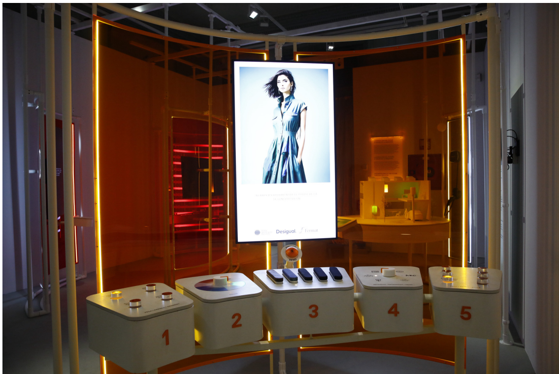
Exposició 'Recorda el futur' a Palau Robert

MWCcapital i Desigual presenten el primer laboratori obert de disseny de moda basat en Intel·ligència Artificial Generativa. L'experiència permet als visitants dissenyar una peça de roba personalitzada i única mitjançant la unió de tecnologia i moda. Una proposta que explora el futur de la indústria i que s'avança a les noves dinàmiques creatives que veurem properament.