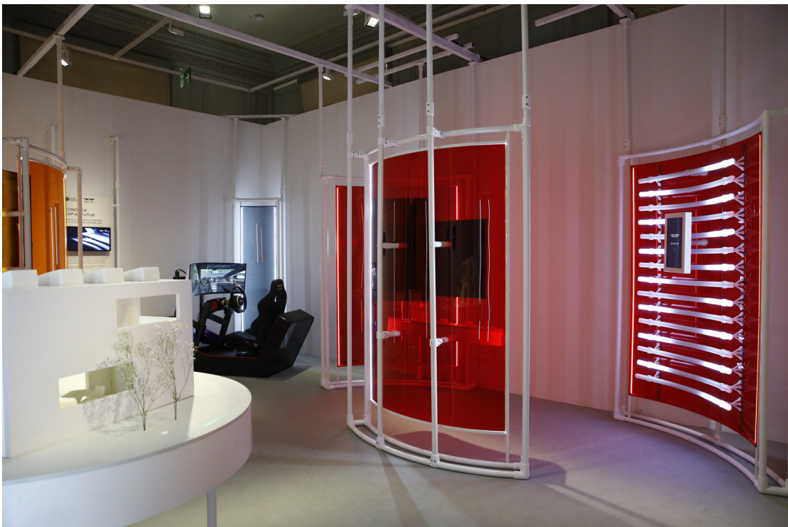
Exposició ‘Recorda el futur’ a Palau Robert