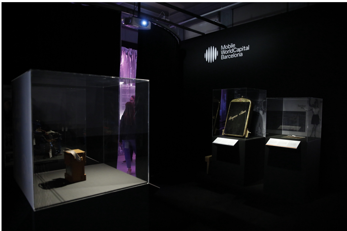
Exposició 'Recorda el futur' a Palau Robert

En la primera part del recorregut, s'exposen els originals d'alguns invents revolucionaris de l'últim segle i s'explica el context en què es van produir, la seva rellevància i els canvis que van comportar a nivell social, econòmic i cultural. Peces històriques, fabricades a Catalunya, com una de les primeres plaques de circuits integrats (precursora dels actuals microxips), un telar motoritzat, un pioner amperímetre per mesurar el corrent elèctric o el radiador d'un cotxe Hispano Suiza.