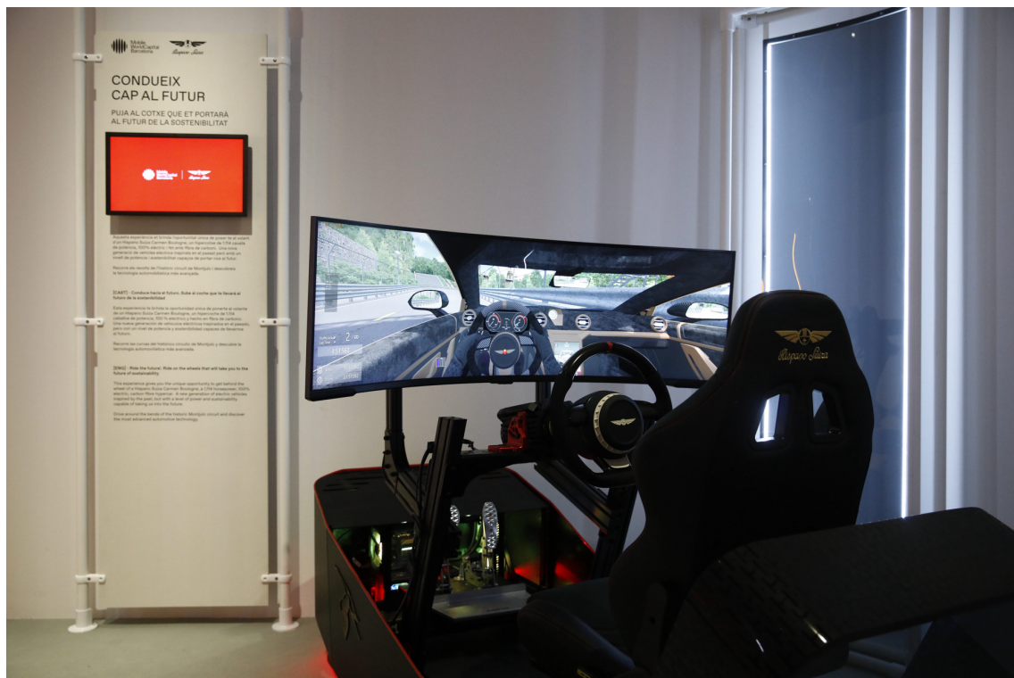
Exposició 'Recorda el futur' a Palau Robert

MWCapital i Hispano Suiza porten a l'exposició el primer simulador que permet pilotar l'hypercar 100% elèctric Carmen Boulogne. Tecnologia d'avantguarda per simular els seus 1.114 CV i la seva ultra acceleració (de 0 a 100 Km/h en 2,6 segons), amb l'al·licient afegit de conduir per un recorregut que emula el mític circuit urbà de Montjuïc. Una experiència que ens acostava a la mobilitat del futur i que mostra el gran potencial que la innovació i l'R+D català està imprimint al cotxe elèctric.