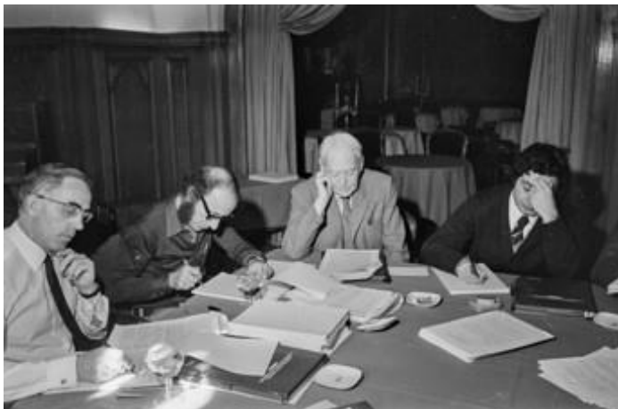
Jornades Internacionals d'Economia a S'Agaró. Al centre, el Premi Nobel d'Economia, John Richard Hicks, 1975.

Des de 1975, l'Hostal de La Gavina ha acollit jornades econòmiques internacionals amb figures destacades, incloent cimeres sobre la transformació econòmica de la Unió Europea.