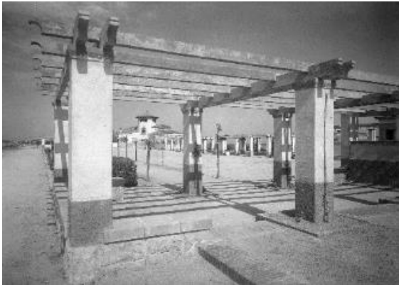
La pèrgola de la plaça del Roserar, amb el xalet Domus Nostrum al fons, c. 1930. Fotografia d'Adolfo Zerkowitz

de l'Esperança, i tot i les interrupcions per la guerra, Ensesa va completar el camí de ronda el 1954, amb detalls finals acabats el 1989.