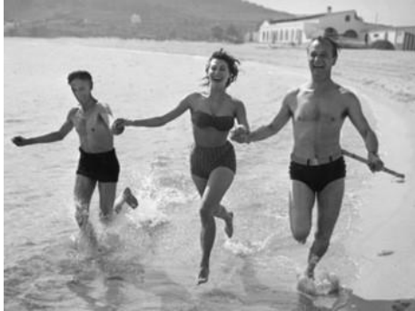
John Laurie, Ava Gardner i Nigel Patrick durant un descans del rodatge de Pandora, 1950.