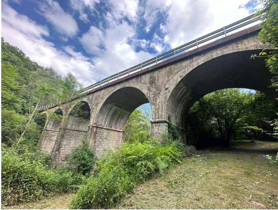
Pont actual de la C-38 entre Sant Pau de Segúries i Camprodon

La carretera C-38, de la xarxa bàsica, creua el Ter a la sortida de Sant Pau de Segúries en sentit a Camprodon, amb un viaducte d'arcs de formigó que té una amplada –5,5 metres, força més estret que la resta de la carretera– i un traçat – en revolt i contra revolt– que pot dificultar la conducció en aquest entorn.