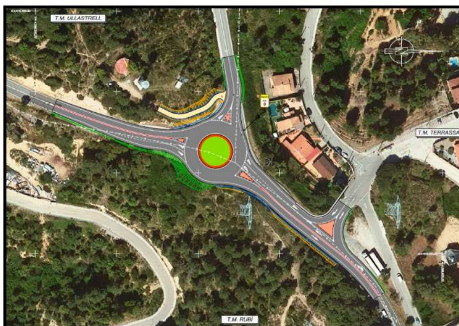
Una de les rotondes que es construirà, a la C-243c a Ullastrell

El Departament de Territori té en fase d'inici un conjunt d'obres per a pacificar el trànsit i millorar la seguretat viària a la C-243c entre els termes de Terrassa i Castellbisbal, que comportaran una inversió de 3,8 MEUR. Aquestes actuacions consistiran principalment en la construcció de rotondes, la configuració d'itineraris per a vianants i la pavimentació de cunetes.