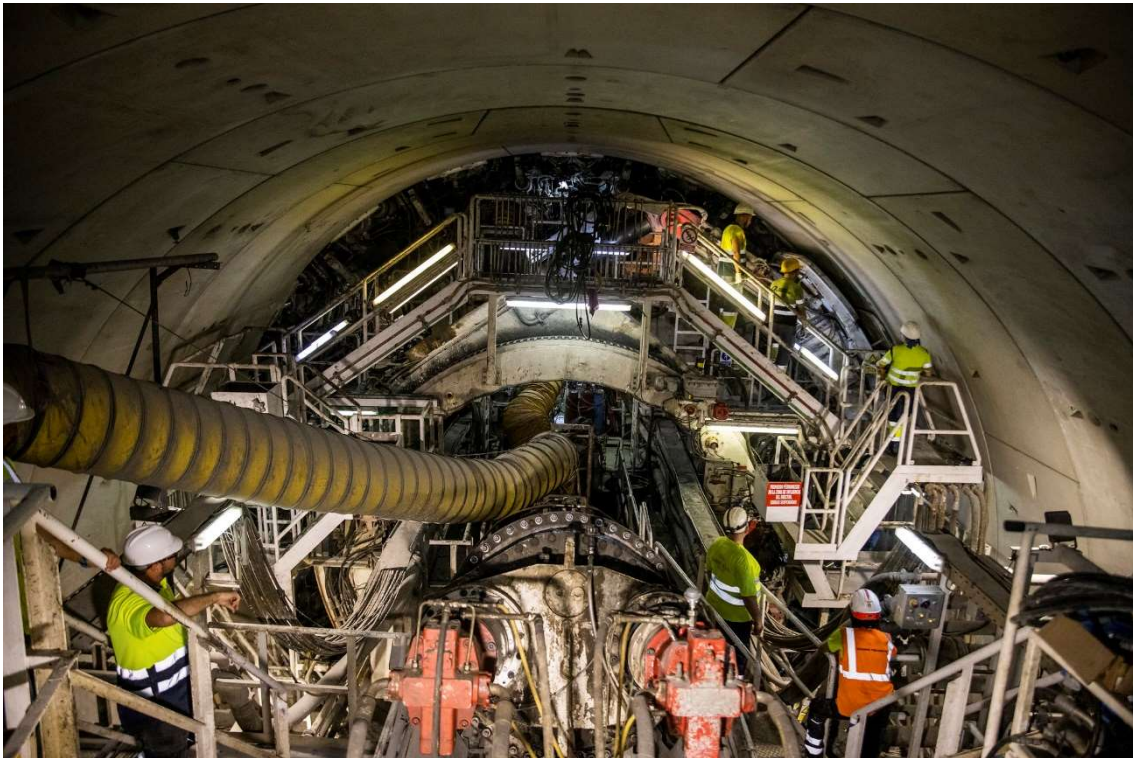
La tuneladora del tram central de l'L9/L10

Avancen els treballs a les estacions de l'L9/L10, arriba la tuneladora a Mandri i comencen les obres a Macropou