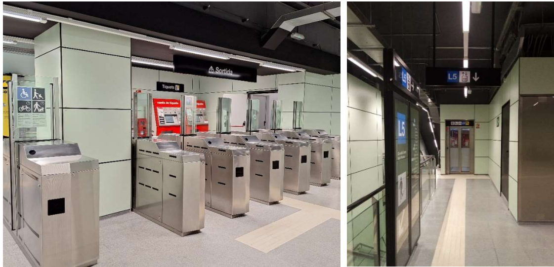
Adaptació recentment finalitzada a l'intercanviador de Maragall

Un altre dels eixos de les actuacions de Territori per afavorir el transport públic és facilitar-ne l'accessibilitat. Actualment, estan adaptades 154 de les 163 estacions en servei a la xarxa de metro de l'àrea de Barcelona, una xifra que suposa un 94,5% del total, i el Departament està treballant per assolir-ne el 100%. Així, té en marxa obres d'adaptació de diverses estacions de metro, alhora que executant treballs de millora en l'accessibilitat en estacions que ja estan adaptades.