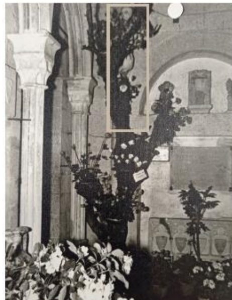
La Lleona a Sant Pere de Galligants, coberta per un muntatge vegetal en ocasió de “Temps de Flors”, 1965.