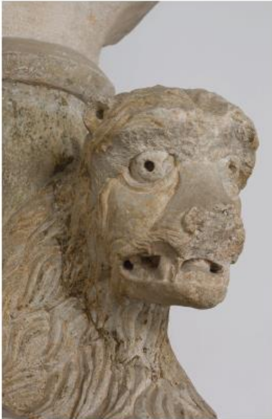
El rostre de la Lleona.

L'apartat final de conclusions aplega el resum de tot l'estudi, i inclou un recopilatori de notes, cites i bibliografia de l'obra. Tal com conclou l'autor: "malgrat els interrogants nombrosos que encara queden pendents, l'estudi en profunditat de "la Lleona" (o del lleó de Girona) ha aportat dades i informació rellevant que permeten revisar els coneixements que, d'aquesta peça escultòrica, hem assumit tenir fins ara".