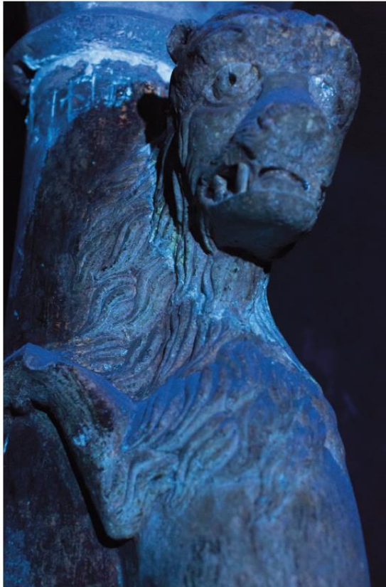
Anàlisi de la Lleona, sota llum ultraviolada.

El segon bloc de l'estudi està dedicat a una acurada descripció de l'element i al resum de totes les anàltiques que s'han fet, tant de la pedra com de les restes de policromia que es conserven. Uns resultats que fan evident que la base i el capitell de la columna són posteriors al fust i l'escultura del lleó, treballat en pedra calcària nummulítica de Girona; i que les restes de policromia són totes elles fruit de successives repintades d'època moderna, amb fins a una dotzena de coloracions diferents. Per a l'estudi científic, s'ha comptat amb el suport del Centre de Restauració de Béns Mobles.