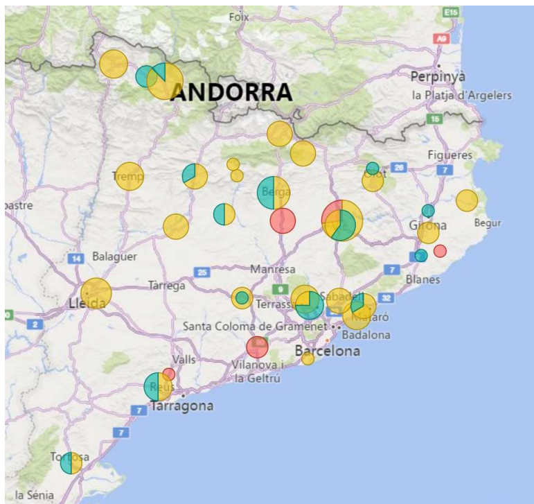
Ubicació de les llevaneus

El Departament de Territori, Habitatge i Transició Ecològica a més de desenvolupar el Pla de Vialitat Hivernal anualment, participa en els plans especials d'emergències, el NeuCat (per nevades) i l'AllauCat (per allaus), que s'activen davant d'episodis de fred i neu extraordinaris.