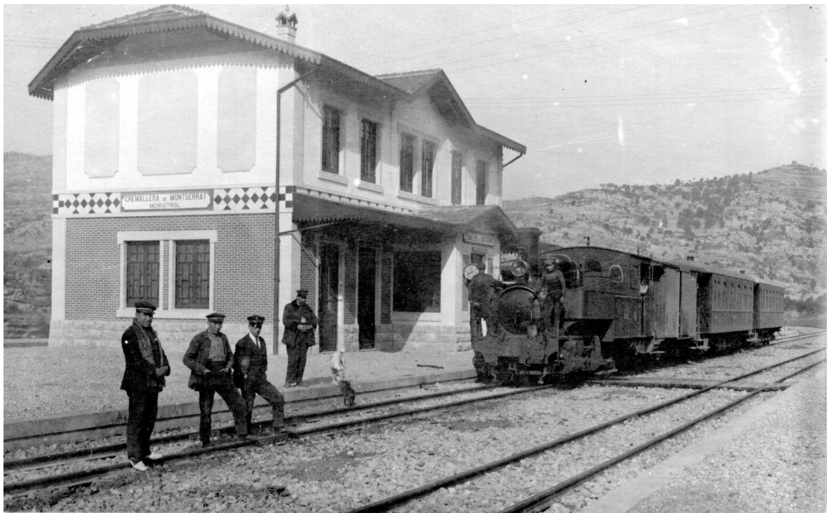
Una foto digitalitzada de l'estació del cremallera de Monistrol, de l'any 1925.

Ferrocarrils de la Generalitat de Catalunya (FGC) ha licitat avui la tercera i darrera fase de la digitalització del seu fons històric, format per dos milions i mig de documents, procedents de les companyies ferroviàries antecessores d'FGC. L'objectiu és garantir la preservació de tot el fons documental de la companyia, així com la millora de la seva accessibilitat.